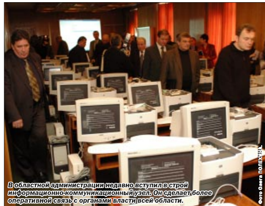
В областной администрации недавно вступил в строй информационно-коммуникационный узел. Он делает более оперативной связь с органами власти всей области.

Немало жителей региона обращается с просьбой об оказании материальной помощи, обеспечении бесплатными лекарственными препаратами, получении санаторно-курортных путевок и оплате жилищно-коммунальных ус-