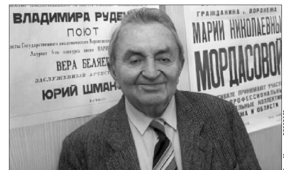
это? Сочинение к дате, по случаю, к приезде?.. Нет, нечто другое.