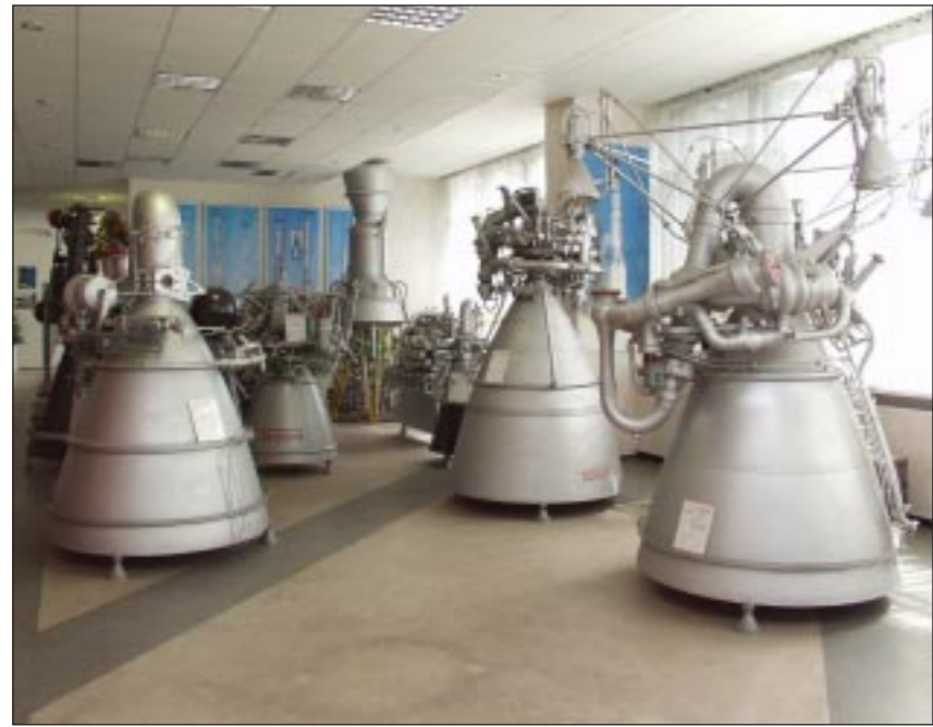
Музей КБХА уже пополняется «водородными» экспонатами.

Водородные технологии позволяют использовать энергию с максимальной эффективностью