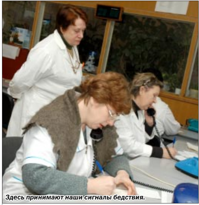
Здесь принимают наши сигналы бедствия.