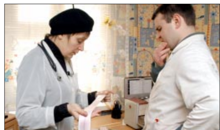
В арсенале бригады анестезиологии и реанимации - 7 разных чеходанов.