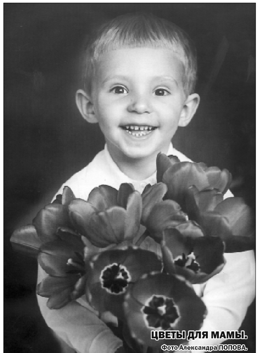
ЦВЕТЫ ДЛЯ МАМЫ.

«Многое объясняет довольно низкое социально-экономическое положение большинства воронежцев, — констатировал Дмитрий Владимирович. — Ирина ШАБАНОВА».