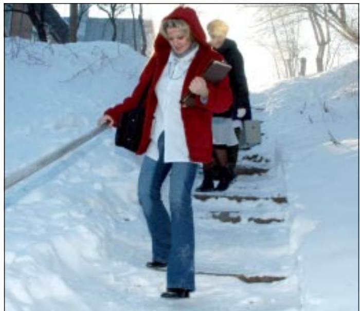
За выезды в отдельные районы медикам можно присваивать категорию сложности.

В 2005 году бригады «Воронежской городской станции скорой помощи» выезжали по вызову 302 874 раза - в последние 5 лет отмечается увеличение количества обращений от населения. Главный врач на этот счет имеет разговор: чем лучше будет работать, тем больше будут