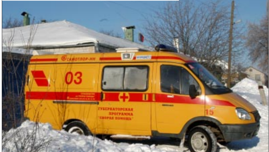
Даже лекарства зимой приходится греть — замерзают в машине...