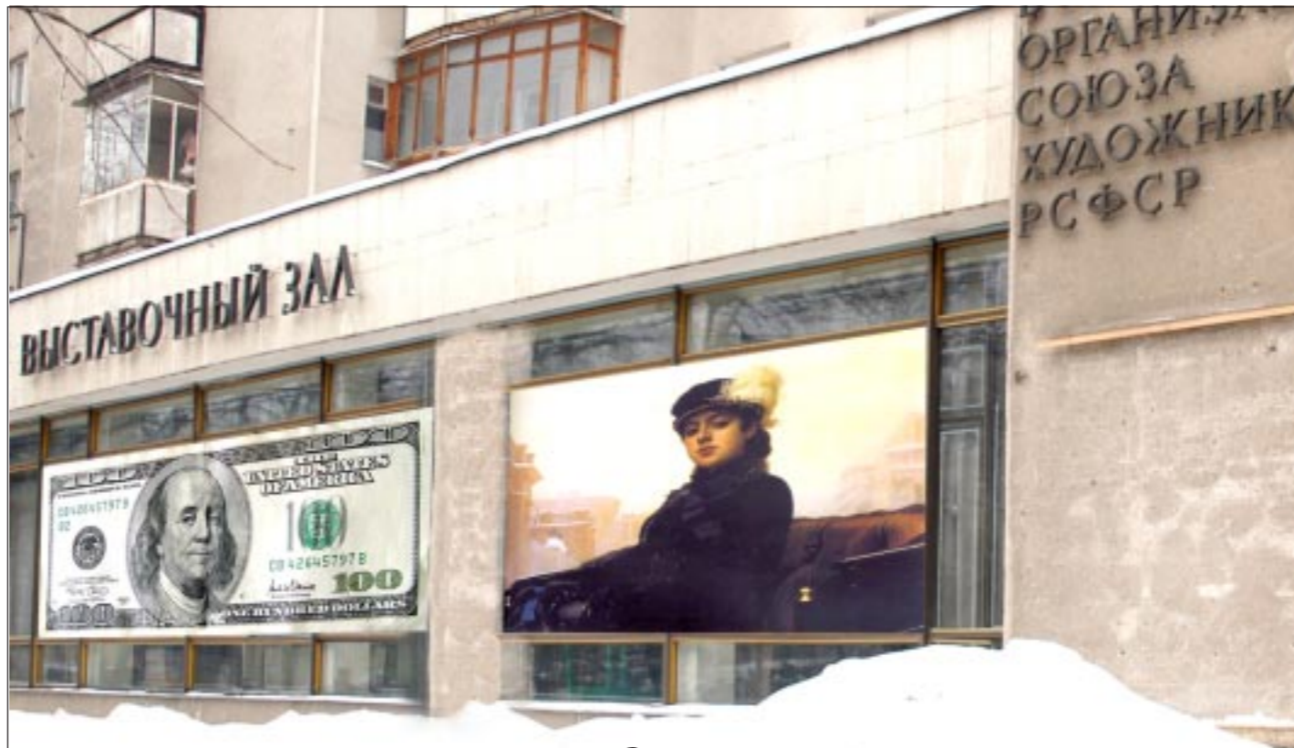
Вопрос нашего времени: деньги или искусство?