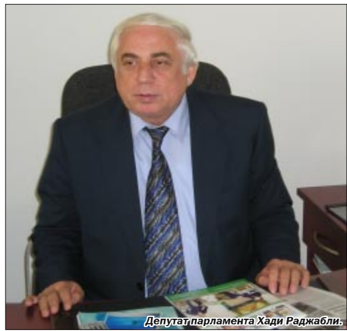
Депутат парламента Хадид Раджабли.