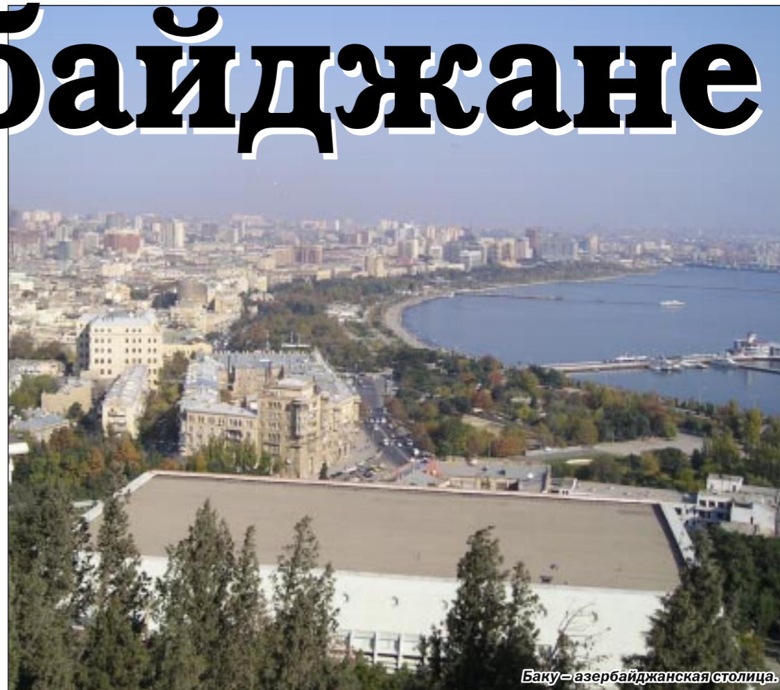
Баку – азербайджанская столица.