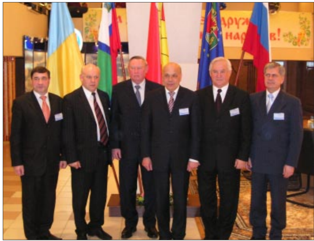
После церемонии подписания - фото на память.

Отвечая на вопрос «Коммуны» по проблемам трудовой миграции, которую в России намереваются поставить в жесткие рамки, глава Луганской облгосадминистрации подчеркнул, что «Конституция Украины гарантирует гражданам свободу передвижения, и право любого человека найти себе достойный заработок и лучшую жизнь. Украина здесь препятствием никак не имеет... Я считаю, надо идти на установление двусторонних отношений на этом уровне. Если у нас есть избыток рабочей силы, а где-то ее не хватает, надо, чтобы люди работали легально, не чувствуя себя второсортными, и приносили пользу экономике Украины и России».