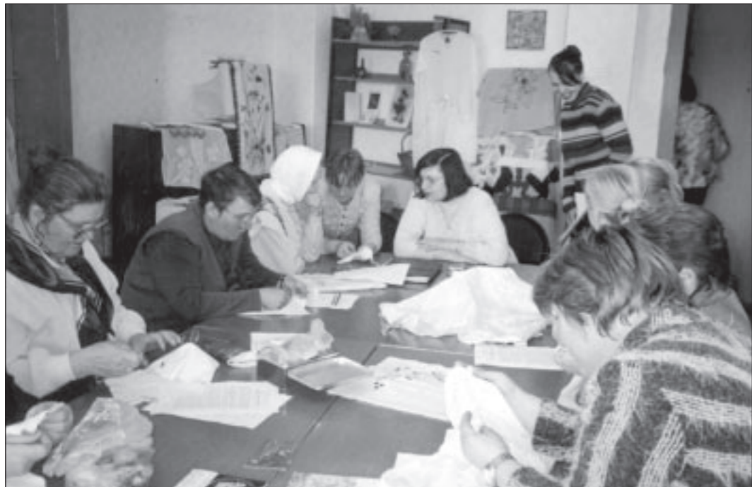
Занимаются мастерицы из клуба «Марья».