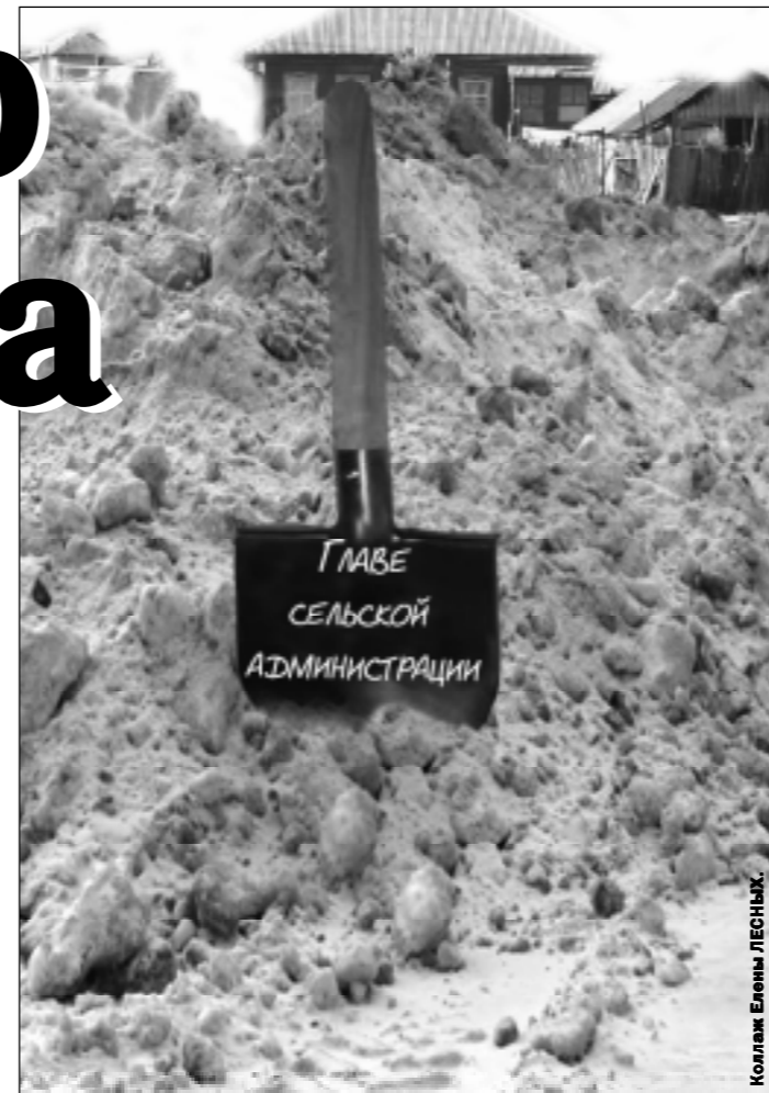
Колос Елены ЛЕСНЫХ.

Каждый снегопад, вспоминает Л. Приходько, — был для нас не просто испытанием, а пыткой. К телефону стыдно было подойти: людям нужно на работу, в больницы, на почту, в магазины, а дороги — по пояс в сугробах. А у нас этих дорог — 130 километров на 34 улицах в 13 поселениях администрации. Где брать технику, чтобы их расчистить? Местное хозяйство, конечно, выручало, но только после того, как расчистит свои дороги и объекты, — на это уходило 2-3 дня. Теперь с такой техникой мы ни от кого не зависим.