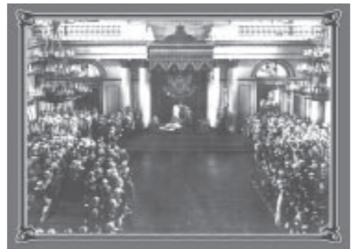
Члены Государственной Думы в Зимнем дворце на приеме у Императора Николая II по случаю открытия Думы 26 апреля 1906.