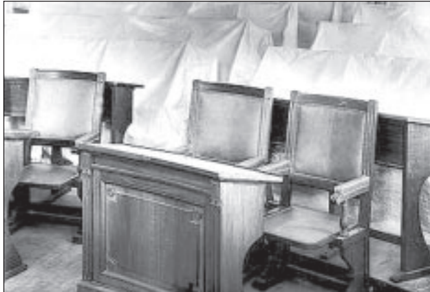
Спустя 72 дня. В центре зала Государственной Думы.