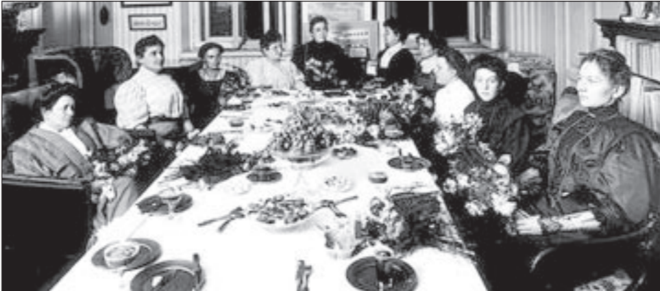
Жены депутатов Государственной Думы устраивали свои «заседания».