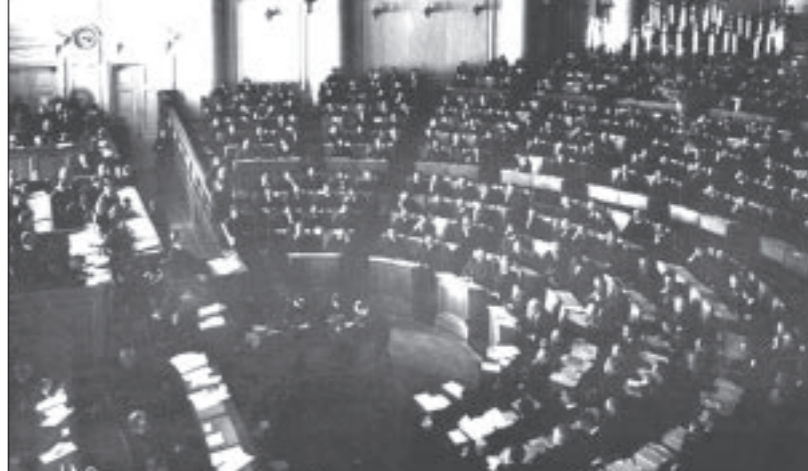
Первое заседание в Таврическом дворце.