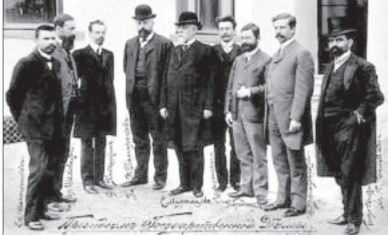
Президиум Государственной Думы.