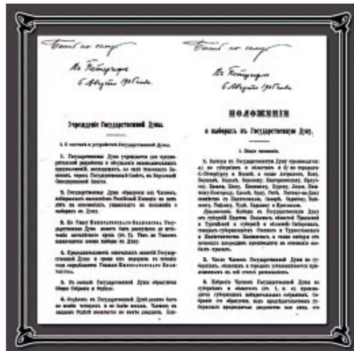
«Учреждение Государственной Думы» и «Положение о выборах» от 6 августа 1905 года, подписанные Николаем II.