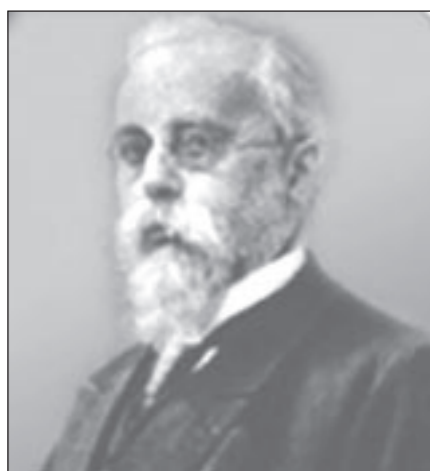
Председатель Государственной Думы первого созыва (1906 год) - Сергей Андреевич Муромцев.