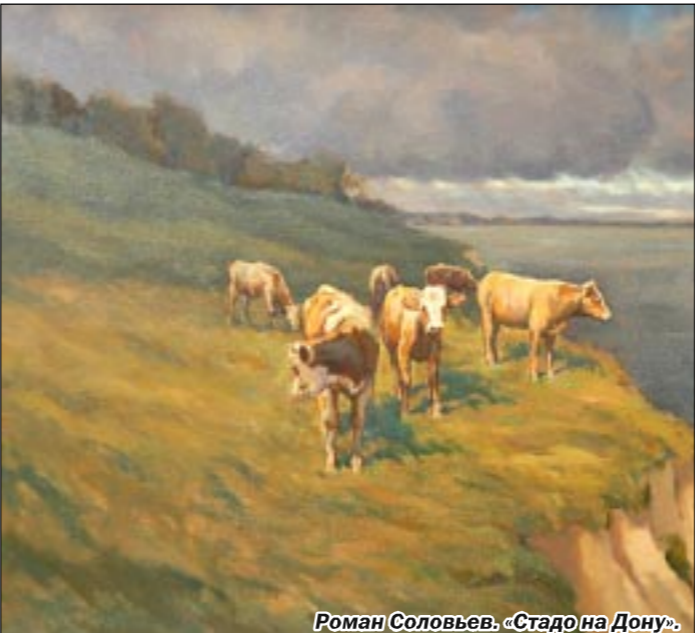
Роман Соловьев. «Стадо на Дону».