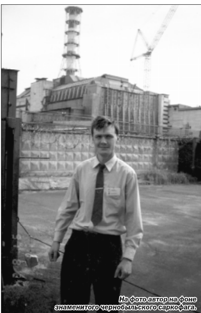
На фото автор на фоне знаменитого чернобыльского саркофага.

Автобус мчал нашу группу из Киева прямо в Чернобыль. Салон был забит журналистами, решившими тоже «не упустить шанс». Причем состав был похуже, чем на состоявшейся днем ранее пресс-конференции в парламенте: были и телевизионщики из американской Си-эн-эн, и какой-то польский телеканал, двое газетчиков из Франции, коллеги из Москвы и Питера и даже один журналист из Австралии... Уже за Киевом все стало с интересом вглядываться в окружающий пейзаж, но с приближением к Чернобылю чего-либо необычного мы так и не нашли. Вплоть до самой границы 30-километровой зоны возделывались поля, мирно пасся скот, кое-где копали картошку в огородах. Но вот КПП и первое предупреждение: «Вход в лес и сбор ягод, грибов категорически запрещен!». И в дальнейшем, уже в зоне, подобные штыки с надписями сознанием воспринимались с трудом. Ведь можно от КПП возвращаться назад, а там в огороде люди работают, да и в лес вроде ходить никто не препятствует. В общем, чернобыльская зона напоминала собой скорее жесткое тоталитарное государство, воздвигнувшее «железный занавес» на границе и зажавшее своих немногочисленных жителей в тиски ограничений: сюда не ходить, там не собирать, здесь не брать и так далее. В итоге там, где были возделываемые поля, теперь заросли кустарника, а то и леса.