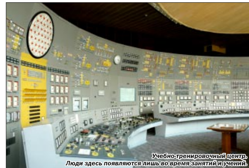
Учебно-тренировочный центр. Люди здесь появляются лишь во время занятий и учений.

Роман КАРМАЗИН, ведущий эксперт Центра изучения проблем ЖКХ.