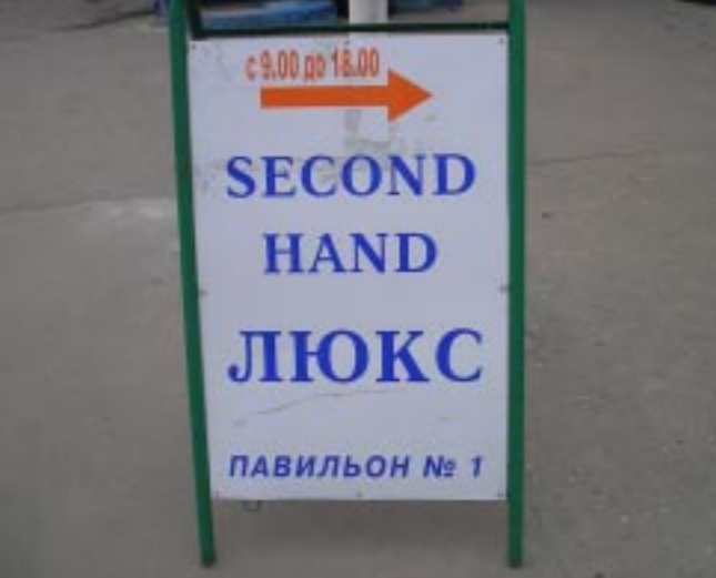
■ А теперь задание для вас, уважаемые читатели. На рынке «Кольцовский» была сделана эта фотография. Автора снимка смугло название павильона. А вас не смущает? Напишите нам в «Коммуну».

В географических и административных названиях слова, обозначающие индивидуальные наименования, то есть имена собственные, пишутся с прописной буквы. Все остальные слова – со строчной буквы. Например, река Волга; переулок Новый; улица Димитрова.