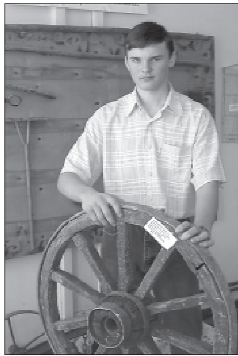
Экскурсовод в музее Алеша Шевченко.