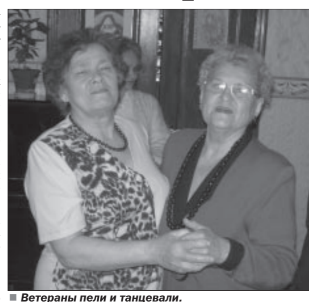
Ветераны пели и танцевали.