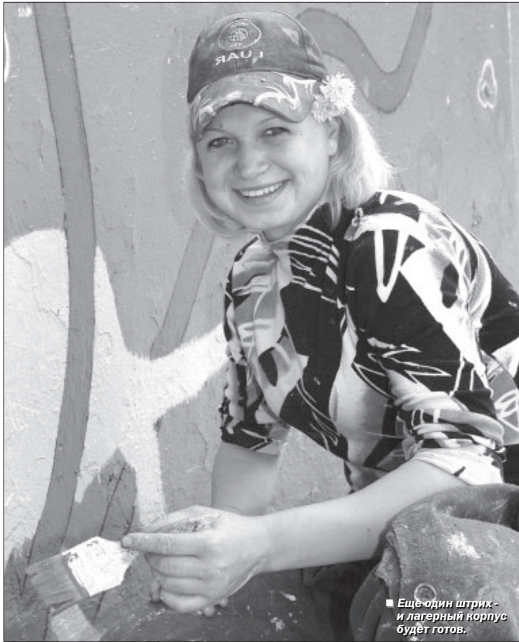
Еще один штрих- и лагерный корпус будет готов.