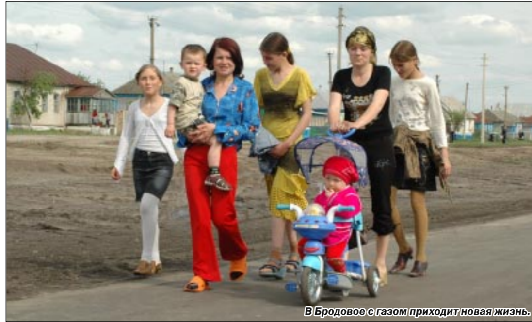
В Бродовое с газом приходит новая жизнь.

ные должники - «Воронежтеплосервис», «Новогор-Воронеж», «Рамонский теплосети», Семилукское ЖКХ. Проблемный вопрос - учет газа. Уровень оснащения приборами учета составляет 36,5 процента. Мы, совместно с администрацией области, готовим программу оснащения приборами учета и надемся, что в ближайшее время она будет одобрена и мы приступим к ее осуществлению.