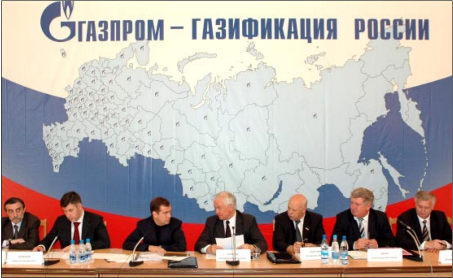
■ Анна стала местом «газового саммита».

Первый вице-премьер намерен включить газификацию сельских районов в национальный проект «Развитие АПК»