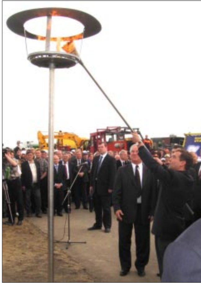
■ Газовый факел в Бродовом зажигает Медведев.

более 85 процентов (средний показатель по стране - около 75). Тем не менее положение должно меняться. Инвестиции в газовую сферу области за последние три года увеличились в 9 раз («это хорошая цифра»). Вместе с тем Медведев посетовал на «крайне слабую газификацию сельской местности». На селе обеспечение природным газом составляет 36 процентов, но ведь более трети жителей области - сельские. - Возрастные финансовые возможности «Газпрома» позволяют нам серьезно повысить темпы газификации области, - говорит Дмитрий Медведев. - На эти цели по программе газификации регионов «Газпром» в 2006 году предусмотрено выделить 892 миллиона рублей. Это одна из наиболее значимых и внушительных цифр по стране... (Окончание на 2-й стр.)