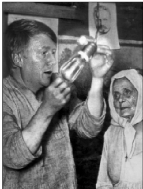
Анатолий Чубайс стал главным электриком России.