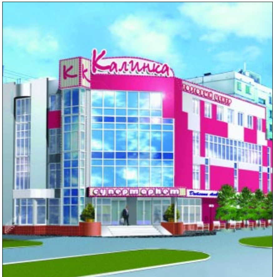
Такой будет «Калинка».

ООО «Фактория» в соответствии с условиями договора простого товарищества от 23.07.2004 г. (далее договор), заключенного между ООО «Фактория» и ООО «ГИД» (местонахождение: 394000, Россия, Воронежская область, г. Воронеж, проспект Революции, д. 11; ОГРН 1033600032729; ИНН 3662011962), осуществляет финансирование и строительство здания торгового комплекса «Калинка», возводимого обществом на земельном участке, находящемся по адресу: г. Воронеж, ул. Генерала Лизюкова, 17а (кадастровый номер земельного участка 36:34:02 03 021:0001; площадь земельного участка: 2160 квадратных метров).