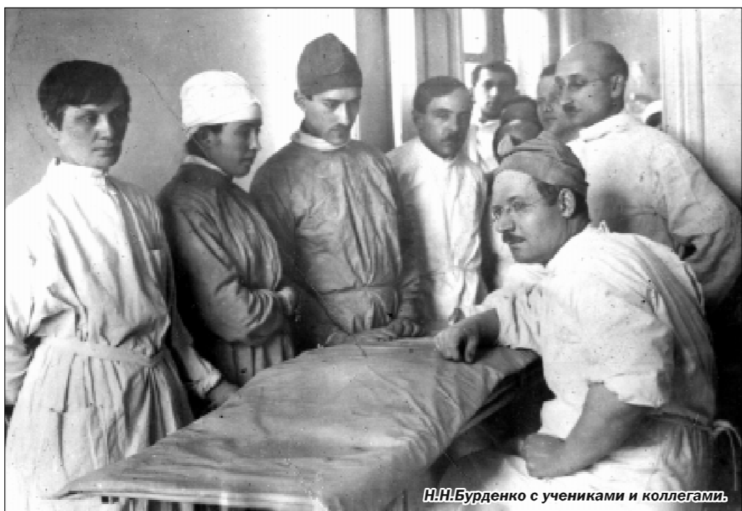
Н.Н.Бурденко с учениками и коллегами.

Но и после его переезда в Москву связь с ним не прекратилась. Связь свой авиотелет, при каждой возможности он