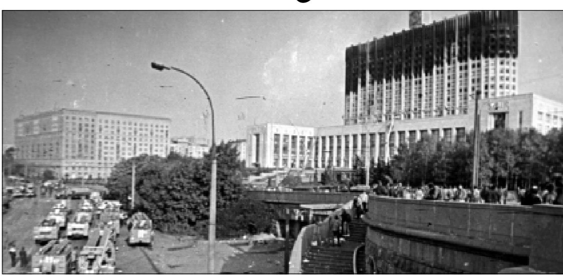
Кто Дню России страна шла через трудные испытания. У многих в памяти события 90-х годов, которые порой заканчивались жестким противостоянием и кровью. Такой увидел Москву в октябре 1993 года наш фотокорреспондент Олег Рябченко.

Праздник лишь тогда почитаем и любим большинством граждан, если в день, когда его отмечают, по-