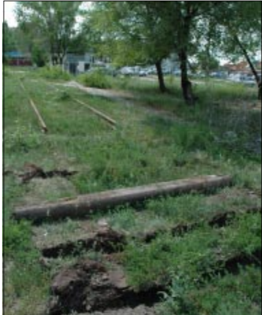
Зарастают травой стальные пути...