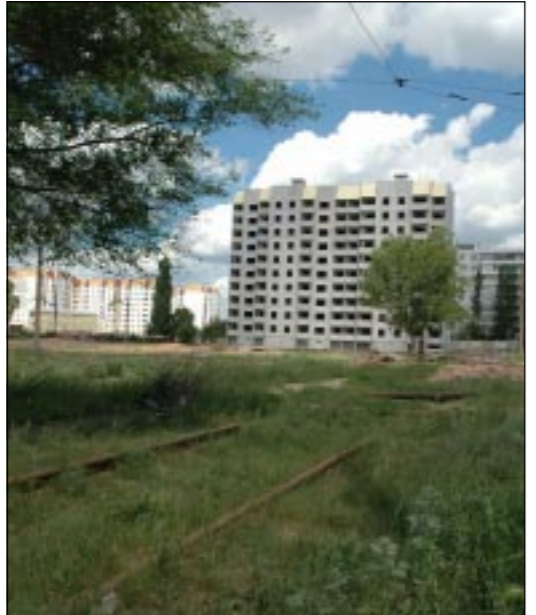
На улице Перхоровича было большое трамвайное кольцо. Теперь здесь – строится дом.