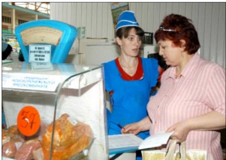
Санитарную проверку проводит специалист Роспотребнадзора.

вается монтаж нового оборудования в пяти холодильных камерах, проведен капитальный ремонт горячих и холодной водой, раковинами для мытья рук. Сделано многое другое, а в целом реконструкция ведется планомерно, поэтапно и, что называется, на научной основе – ад-