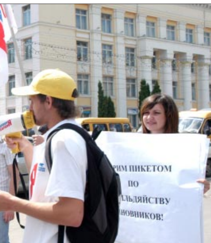
Вчера представители «Молодой гвардии» — молодежной организации «единороссов» — организовали у здания мэрии пикет, как раз тогда, когда чиновники собирались на еженедельную планерку. Выступили против разгильдяйства чиновников и за спорткомплекс для Воронежа.