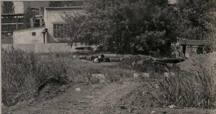
Русло Песчанки засыпано, но река не дает: из-под строительного мусора пробиваются камыши.

На прошлой неделе корреспонденты «Коммуны» откликнулись на очередной призыв о помощи и выехали на место. Попали удачно - как раз на встрече властей с жителями вели беседу представители управления «Воронежгаза», Воронежского областного и районного управлений по охране окружающей среды, представители управления «Воронежгаза» по Воронежской области и Управление по охране окружающей среды администрации. Выяснилось, что все работы связаны с тем, что в районе перулков Отличников прокладывают новую ветку газопровода, причем работы начаты без соответствующего разрешения от Воронежского управления Росприроднадзора и