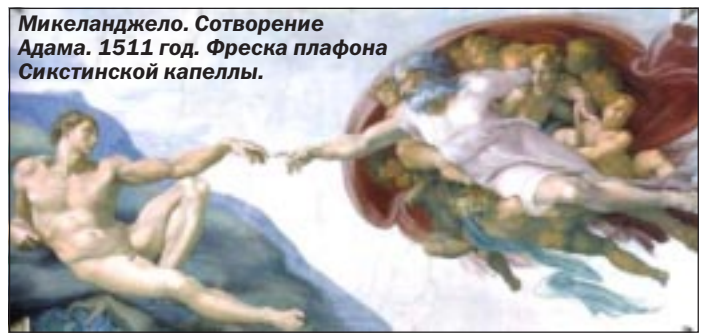
Микеланджело. Сотворение Адама. 1511 год. Фреска плафона Сикстинской капеллы.