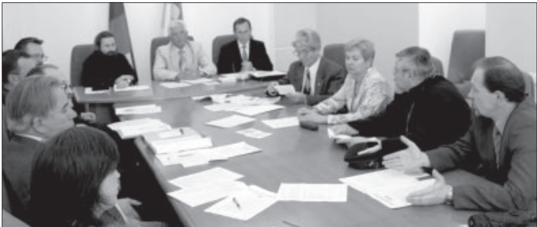
Материалы подготовили: Анастасия ВЛАСЕНКО, Надежда ДОЛИНИНА, Ольга РУДЕНКО.

В следующем году «Рамонский родник» отметит свое пятилетие - первый юбилей, готовиться к которому организаторы начнут задолго до того, как на фестивальной поляне приедет первый гость.