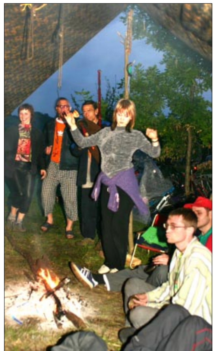
Вокруг костров было и грустно, и весело, и пелось, и танцевалось.