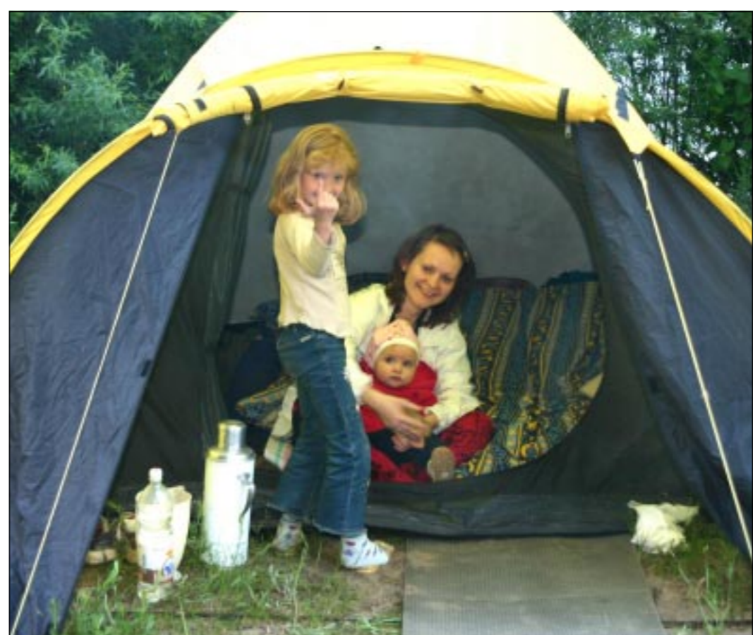
В палатках жили целыми семьями, даже с самыми маленькими крохами, будущими продолжателями фестивальной традиции.