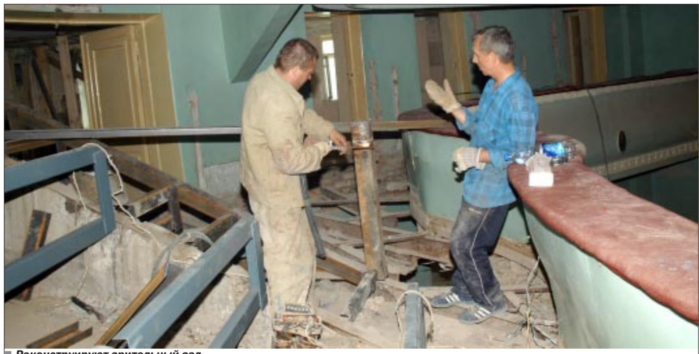
Реконструируют зрительный зал.