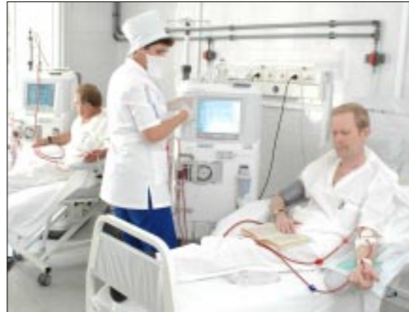
В центре гемодиализа.