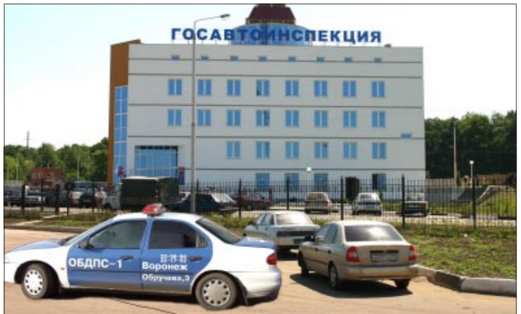
Адрес Правобережного РЭО – ул. Холмистая, 56.