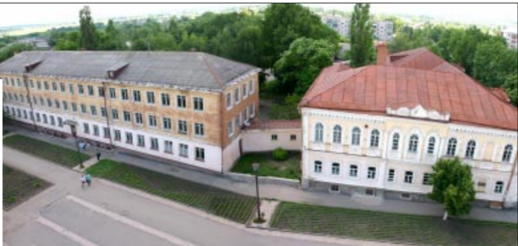
Дом-музей художника И.Н.Крамского.