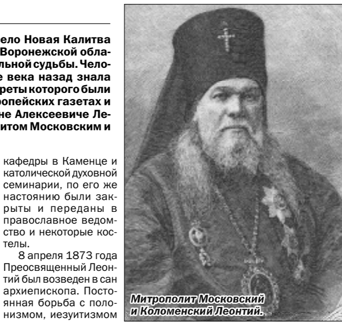
Митрополит Московский и Коломенский Леонтий.

20 декабря 1863 года Пресвященный Леонтий назначен был Подольским епископом. В этой епархии для улучшения быта и просвещения народа он много потрудился в деле устройства церковных братств, приходских попечительств, церковно-приходских школ и приютов. «В видах ослабления католической пропаганды» настоял на закрытии епископской католической