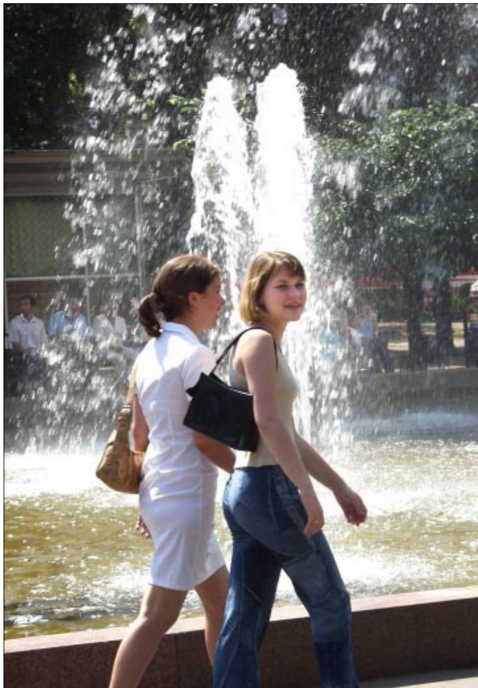
Фонтан в Кольцовском сквере - одно из самых популярных мест в Воронеже в жаркие дни.