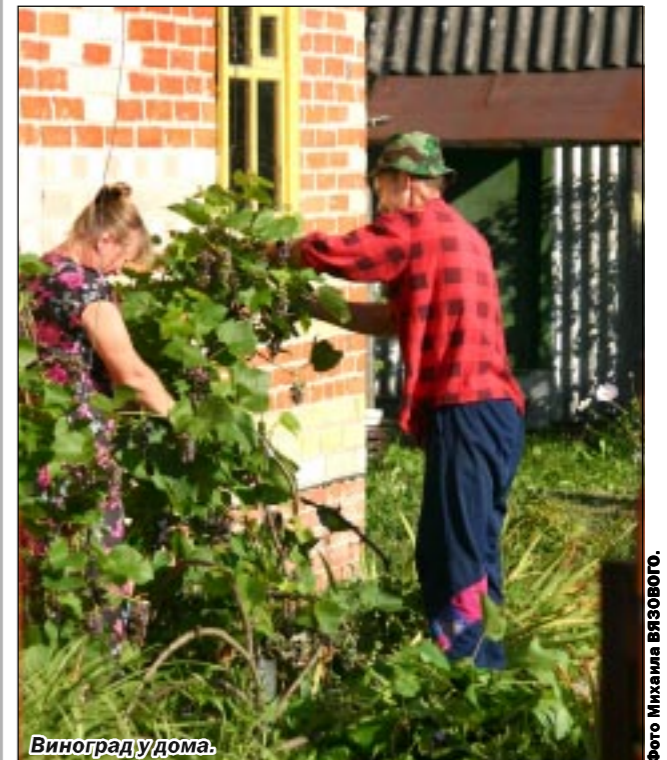
Виноград у дома.