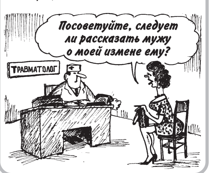
Посоветуйте, следует ли рассказать мужу о моей измене ему?