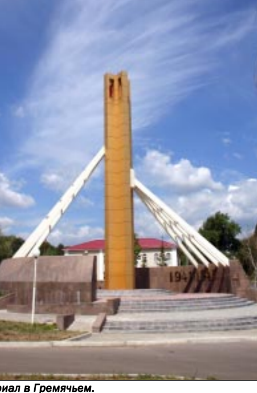
Мемориал в Гремяче.