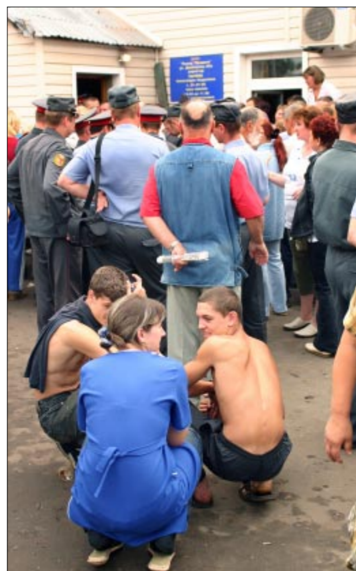
Им не до торговли.