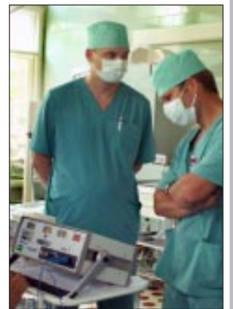
Вот такой маленький чудо-аппарат.

Вчера в Дорожной клинической больнице Воронежа прошла первая в Центральном Черноземном регионе малоинвазивная операция с помощью нового уникального аппарата «COOL TIP».