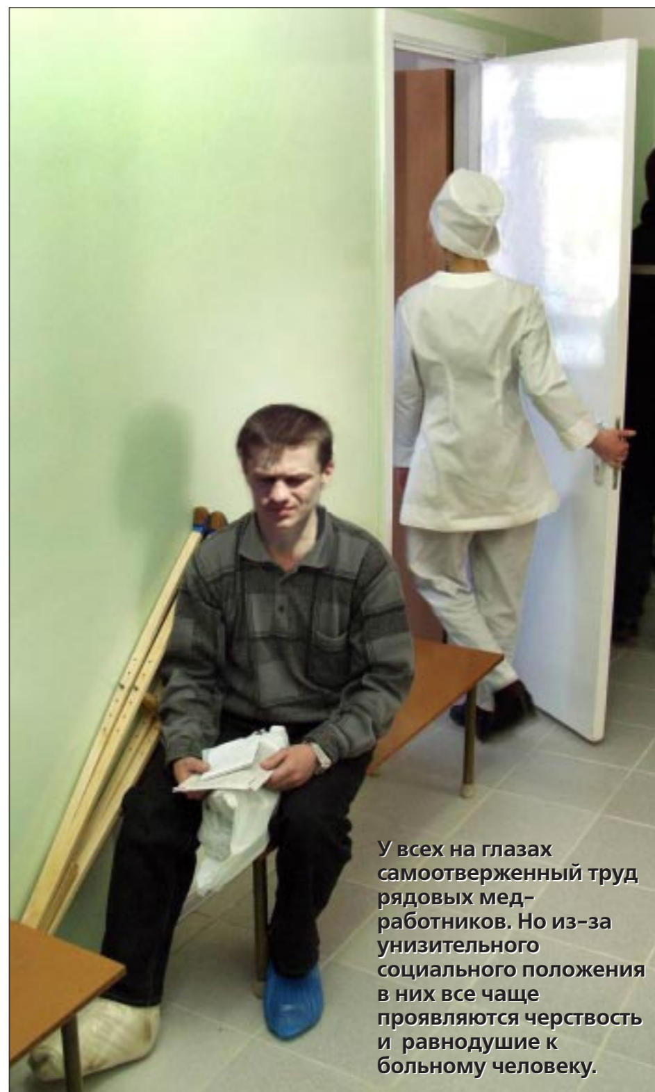
У всех на глазах самоотверженный труд рядовых медработников. Но из-за униженного социального положения в них все чаще проявляются черствость и равнодушие к больному человеку.

Недоумение едва ли не по каждому разделу национального проекта – вот, например, диспансеризация. В советские времена автор этих строк работал в белгородской газете, и каждую весну поликлиника настойчиво приглашала меня на ежегодный медосмотр. Проходил всех врачей, сдавал анализы, вставал под рентгеновский аппарат, и если всё было в порядке, меня отпустили до следующего года. За полтора десятка лет жизни в Воронеже моя территориальная поликлиника № 4 ни разу не приглашала меня на медосмотр. Я – не в претензии, вижу, что врачи с настоящими большими справками не могут. По утрам очереди в регистратуру в три кольца. К «узким» специалистам или к тому же участковому терапевту не пробишься. Какой доктор в такой толче со здоровыми людьми будет возиться и заполнять карточки диспансерных осмотров? Согласно им пациент должен поощряться с андрологом, офтальмологом, неврологом, хирургом, урологом или гинекологом. Ни кардиолог, ни онколог потенциального больного осматривать не долж-