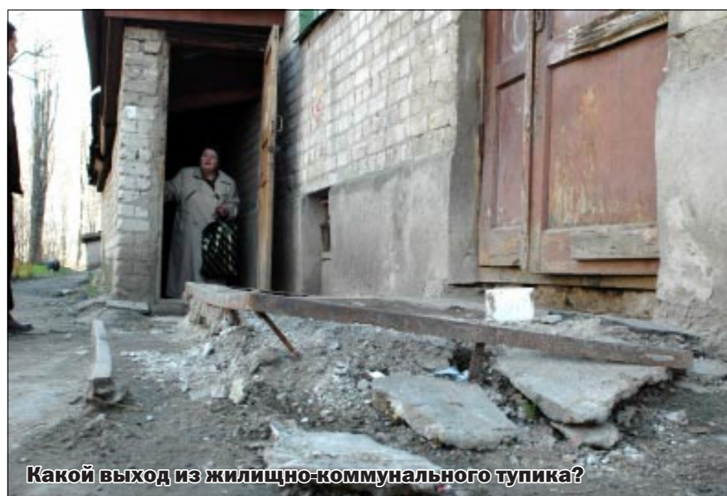
Какой выход из жилищно-коммунального тупика?