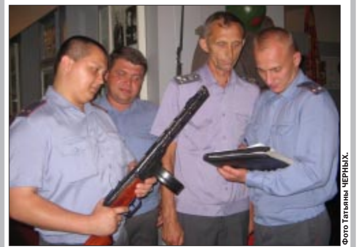
Миллионеры возвращают военную реликвию музею.