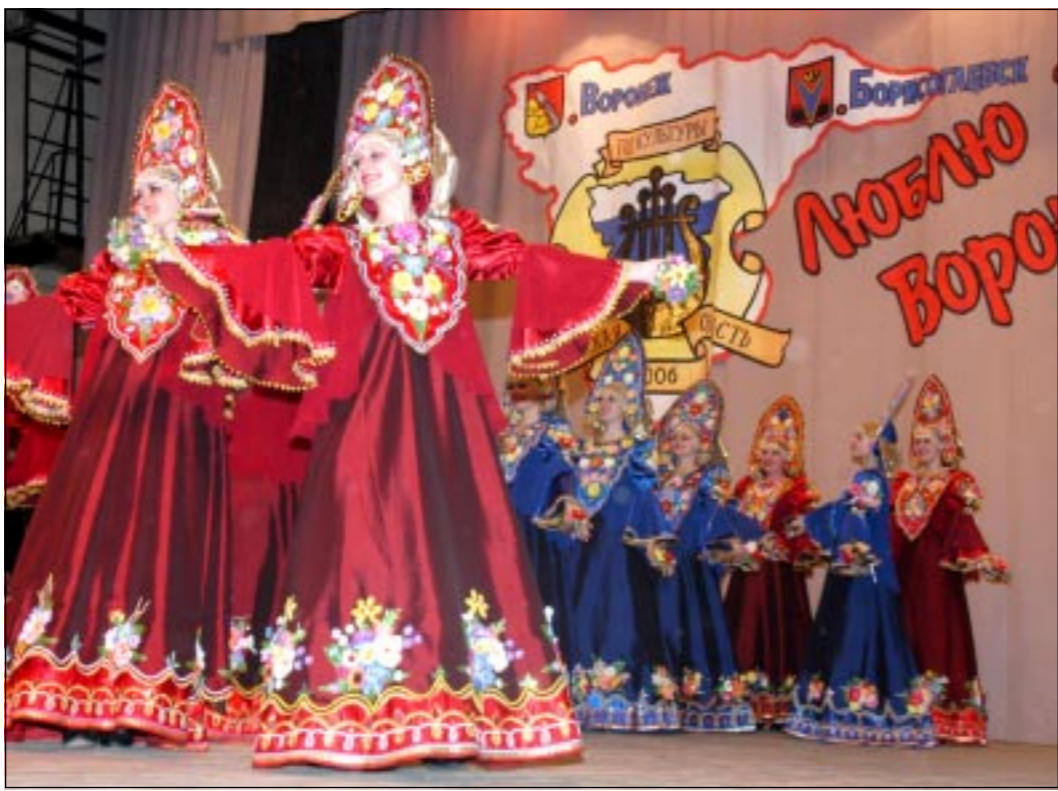
Борисоглебск славится своими самодельными хореографическими коллективами. Искусство сразу нескольких из них могли увидеть воронежцы на недавнем творческом отчете Борисоглебского района.