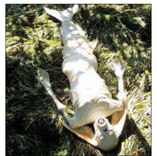
найлены из моря, время от времени на форумах он признается, что сделал эти скульптуры своими руками.

Отметим, что проданный лот на аукционе – чистой воды розыгрыш, хотя деньги за него настоящие. Автор рукотворной русалки – художник из США по имени Хуан Кабана, который создает скульптуры из останков настоящих морских рыб и животных. На сайте скульптора представлены другие его работы. И хотя там он утверждает, что все они