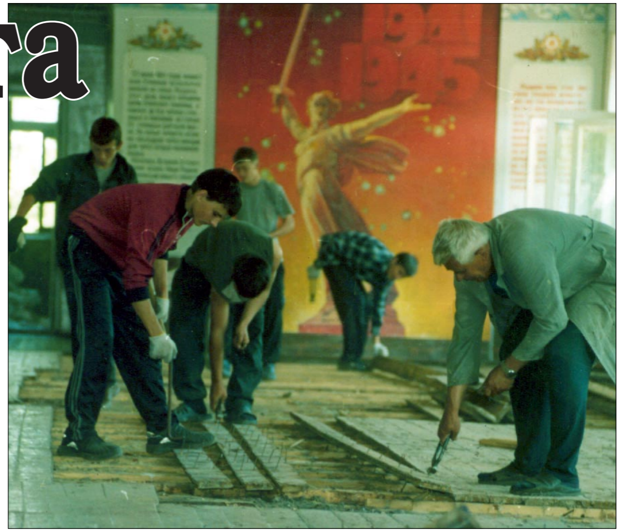
Ремонтные работы в Нижнедевицкой гимназии.

Внутренний облик здания, построенного в 1967 году, ещё сравнительно недавно отличался от нынешнего весьма кардинально. «Был момент, когда у нас даже стена рушилась», – вспоминает директор гимназии. А все потому, что капитальный ремонт лет пятнадцать не проводился. Но в тот день, когда я побывал в райцентре, лишь отдельные кабинеты, где ещё не завершился ремонт, выглядели по-ста-