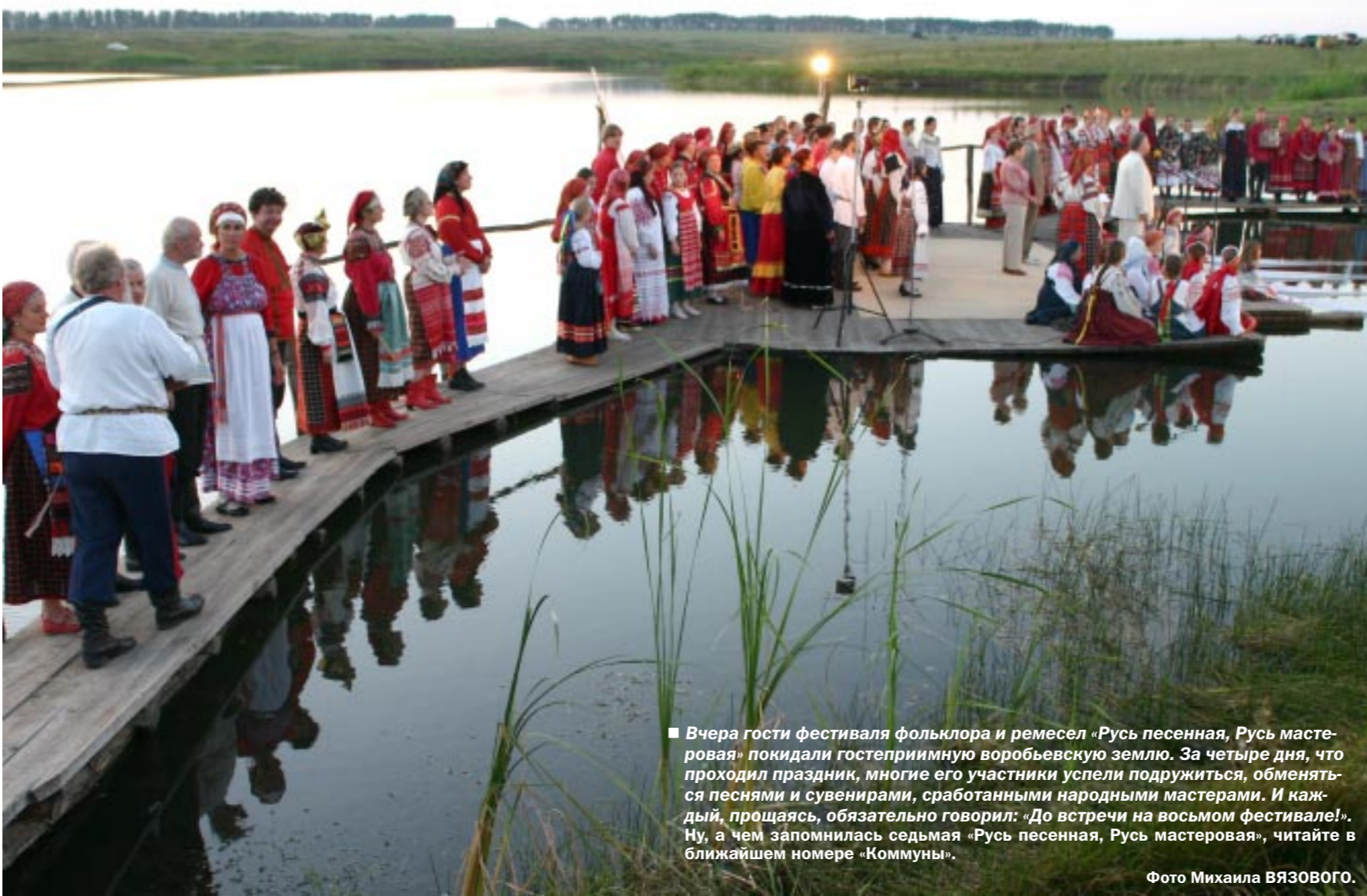
Вчера гости фестиваля фольклора и ремесел «Русь песенная, Русь мастеровая» покидали гостеприимную воробьевскую землю. За четыре дня, что проходил праздник, многие его участники успели подружиться, обменяться песнями и сувенирами, сработанными народными мастерами. И каждый, прощаясь, обязательно говорил: «До встречи на восьмом фестивале!». Ну, а чем запомнилась седьмая «Русь песенная, Русь мастеровая», читайте в ближайшем номере «Коммуны».