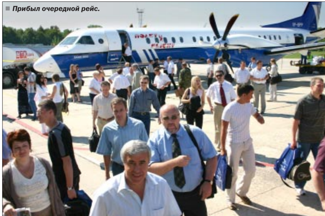
Прибыл очередной рейс.