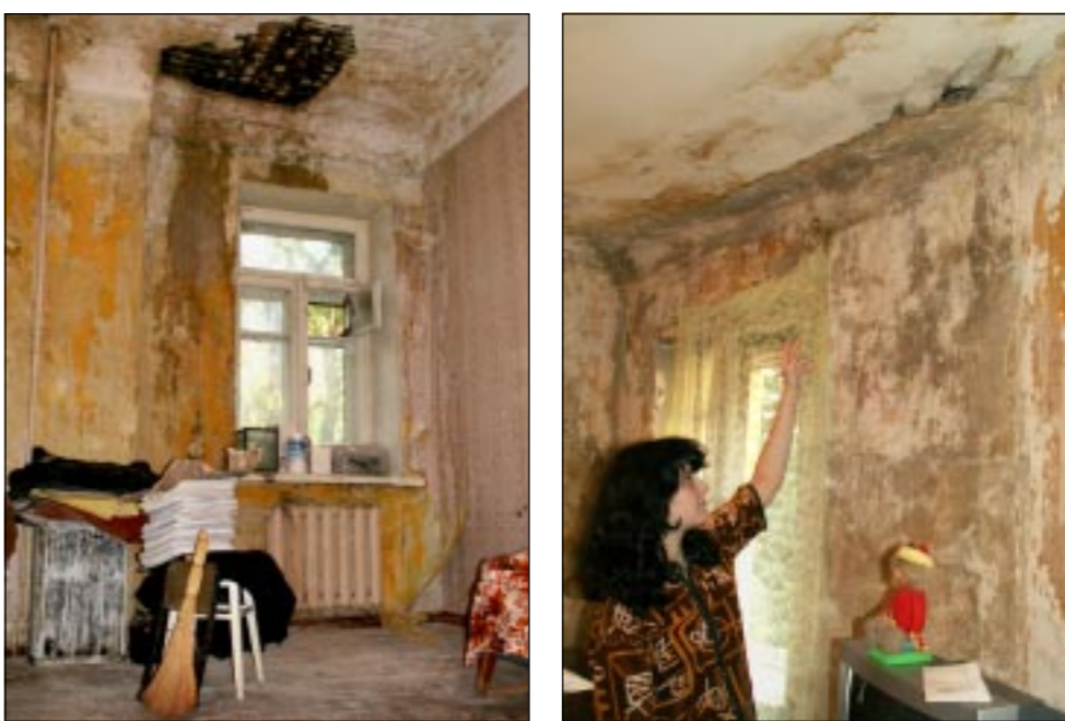
...а в таких условиях живут нынешние обитатели дома-памятника.