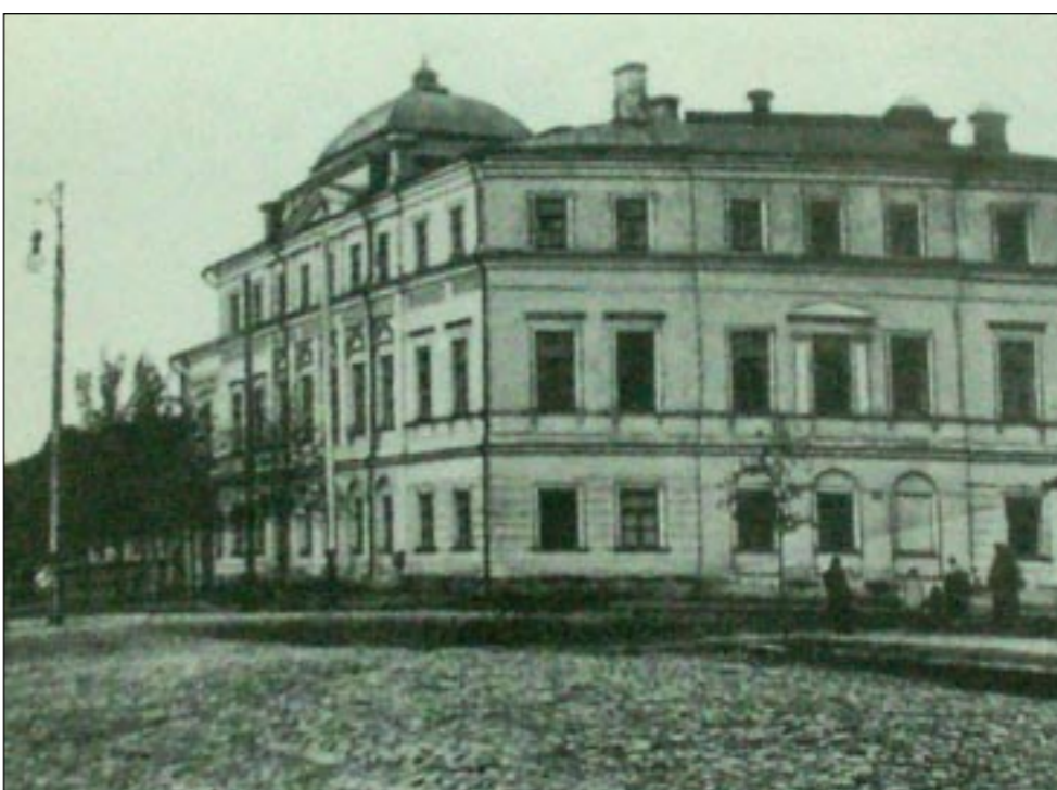
Так выглядела больница Николаевской общины в начале 20-го века...

P.S. Пока материал готовился к печати, в доме-памятнике №72 начали ремонтировать крышу. Хочется верить, что причиной этому стало не вмешательство газеты, а здравый смысл и любовь к родному Воронежу.