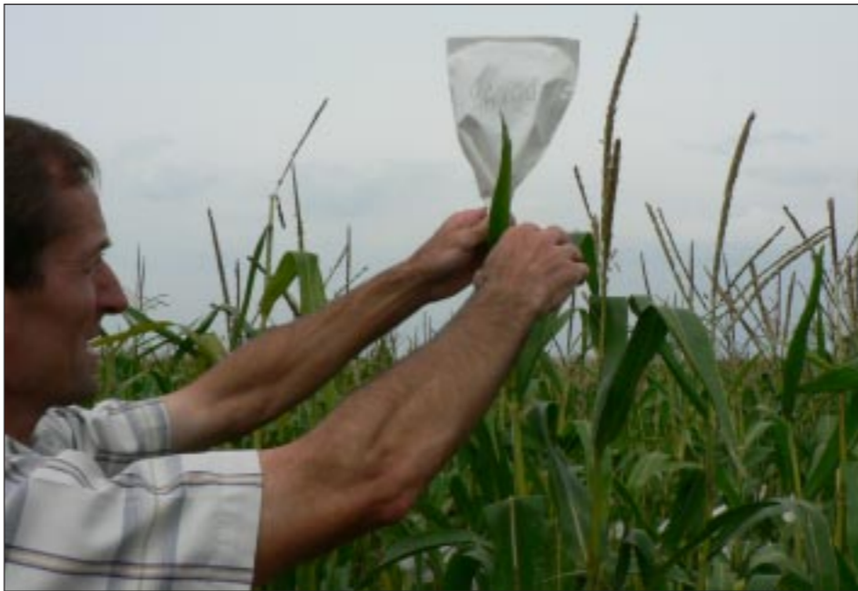
На каждой метелке по 10-20 миллионов частиц пыльцы.

За семидесят лет на станции селекционеры создали 14 новых гибридов кукурузы. В последнюю пятилетку районировали еще 12. Сегодня, главным образом, ведется семеноводство только одного, распространенного в ЦЧР – Каскад-195, остальные гибриды «законсер-