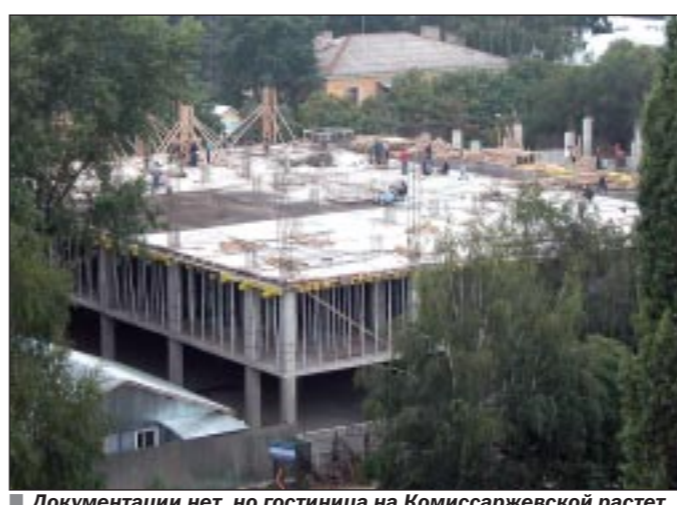
Документации нет, но гостиница на Комиссаржевской растет.