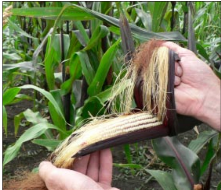
Такие початки найдете только здесь.