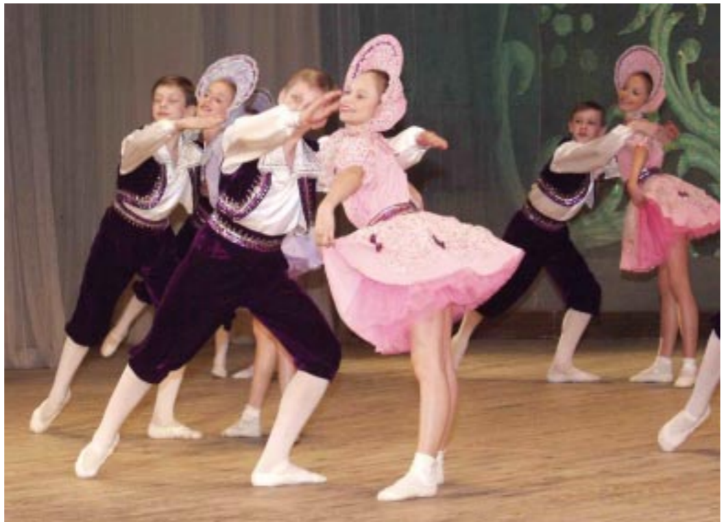
Радуют своей учебной и творческой жизнью учащиеся Воронежского хореографического училища. А сегодня у них есть еще один повод для хорошего настроения: к новому учебному году в училище отремонтированы репетиционные залы и классы.