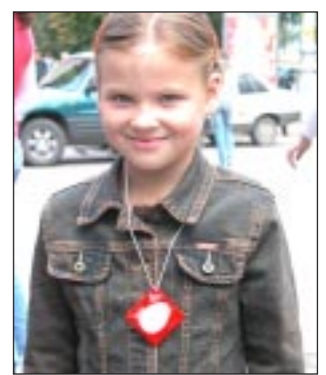
детского дорожного травматизма. По словам организаторов, делать это следует ярко и необычно.

Естественно, маленьким пешеходам не просто внушить, что одному, без присмотра мамы и папы, выбегать на проезжую часть опасно. Следует не просто чаще рассказывать детям о правилах дорожного движения, но и привлекать их внимание к проблеме