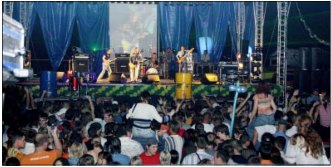
ВАС ПРИНИМАЕТ АДВОКАТ