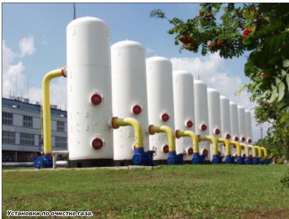
Установки по очистке газа.