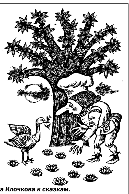
Из иллюстраций Леонида Ключкова к сказкам.