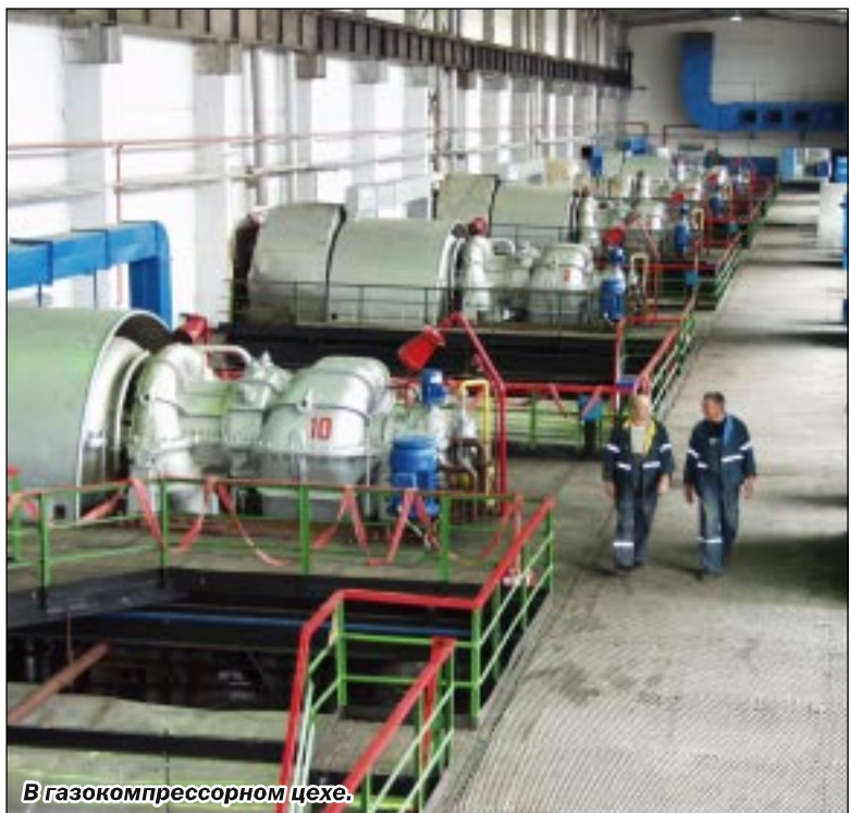
В газоконденсаторном цехе.

В соответствии с положением ст. 13, 14 ФЗ «Об обороте земель сельскохозяйственного назначения» участники долевой собственности на земельный участок из земель сельскохозяйственного назначения, расположенного по адресу: Воронежская обл., Кантемировский р-н, Писаревское сельское поселение, в границах бывшего колхоза «Писаревский», уведомляются о проведении ОБЩЕГО СОБРАНИЯ. Место проведения: Воронежская область, Кантемировский район, Писаревское сельское поселение, с. Писаревка, в здании Дома культуры.