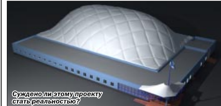
Суждено ли этому проекту стать реальностью?