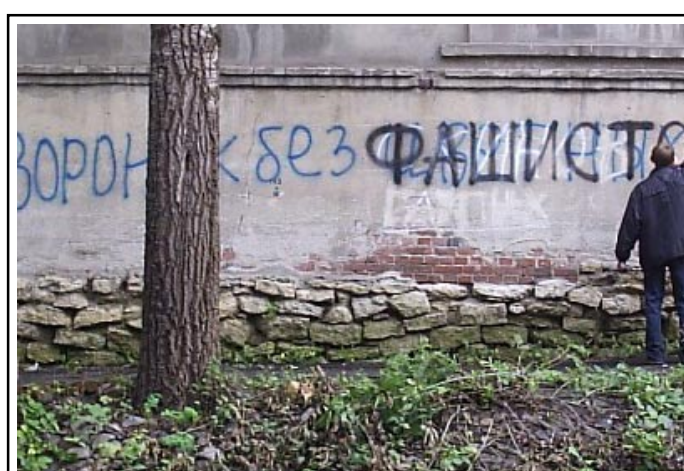
С 1 сентября по 9 ноября проводится общеворонежская акция, цель которой — очистить улицы городов и сел от «символов вражды». В ней активное участие принимает воронежская «Молодежная правозащитная группа». Уже зарисованы экстремистские призывы, надписи и так далее на домах и заборах по улицам Никитинской, Фридриха Энгельса, Карла Маркса, у Петровского сквера и на останке Манежной, в основном они не просто зарисованы или «исправлены»: «символы вражды» сменены на «символы мира» — на их месте появились цветы, снежинки и другие «приятные образы». Воронежцы и ранее проводили подобные акции, делать это они намерены и впредь, но сожалеют: «Мы уже не раз ставили перед городскими властями вопрос о пресечении распространения экстремистского «граффити», но наказания никто не понес».

А что представляют собой наши местные так называемые «экстремисты-неформалы»? Следователи выявили, что на октябрь 2005 года в Воронеже существовали две молодежные группировки под названиями «Витязи» и «Белый патруль», которые «не любили» лиц неслышанной внешности, а также поклонников негритянского рапа. То есть, «Витязи» выступали за «здоровый образ жизни и единение русских». «Белый патруль» — «фильтровал» «неправильных» фанатов, особенно тех, которые носили разгерметизированные ботинки и куртки. Время от времени они активизировали свою совместную деятельность, особенно после выиграного спринтерного. При этом оно имело значительное, если можно так сказать, «выходное из далекой страны или уроженцев российского юга. Однажды, а именно 9 октября 2005 года, 14-18-летние недоросли из обеих группировок устроили разборки на территории спорткомплекса «Олимпик». Сначала пострадали