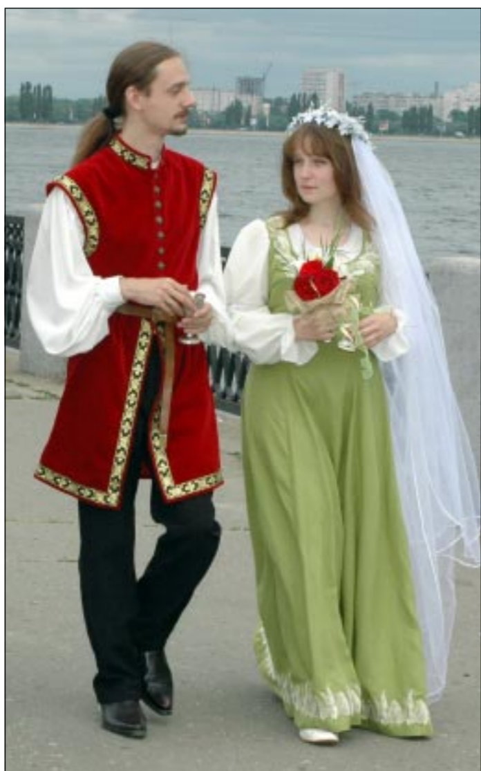
На свою свадьбу эти молодые воронежцы облачились в национальные одежды

или Дорогой, я хочу свадьбу... Экстремальную!