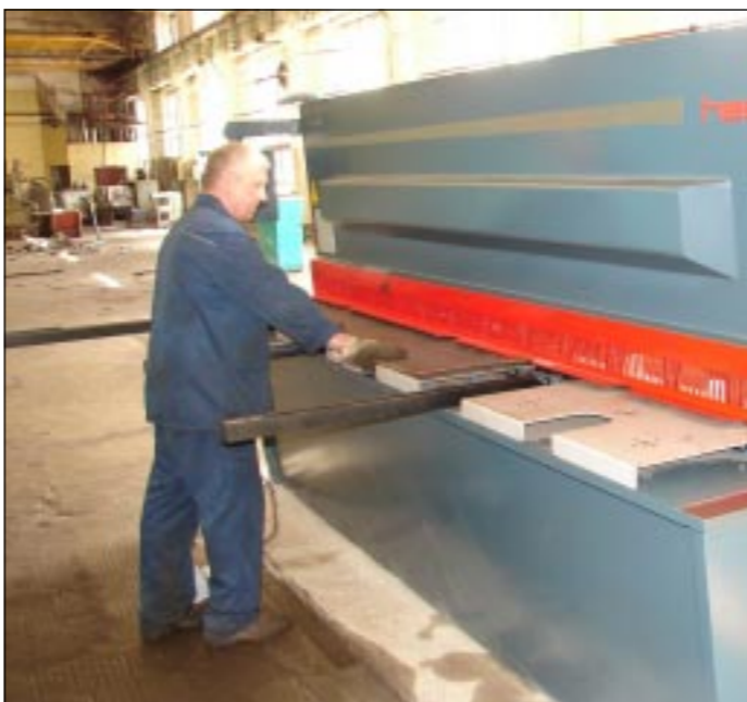
Рабочие открытого акционерного общества «Воронежсельмаш» осваивают новое оборудование.