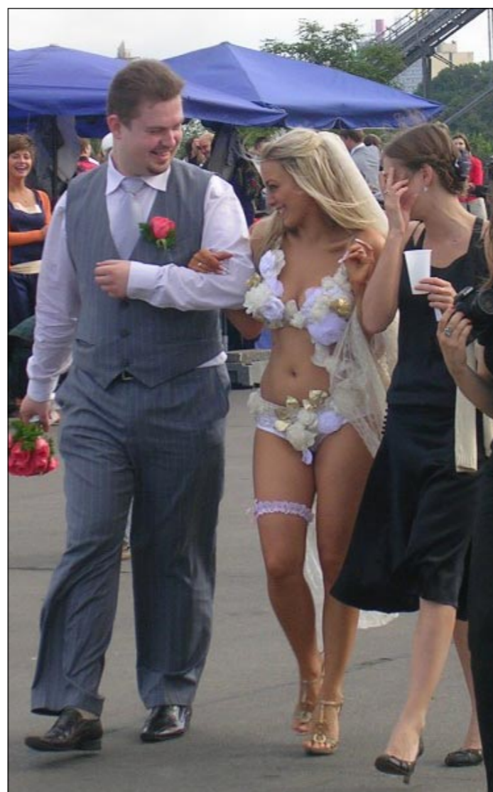
Не войдет ли в моду такой свадебный наряд невесты?

Поздравил телеграммой. Брак этот не удался. Пьяный Василий Иосифович часто бивал молодую супругу, она уходила от него и опять приходила, прощая его измены. Сразу после Великой Отечественной войны они расстались.