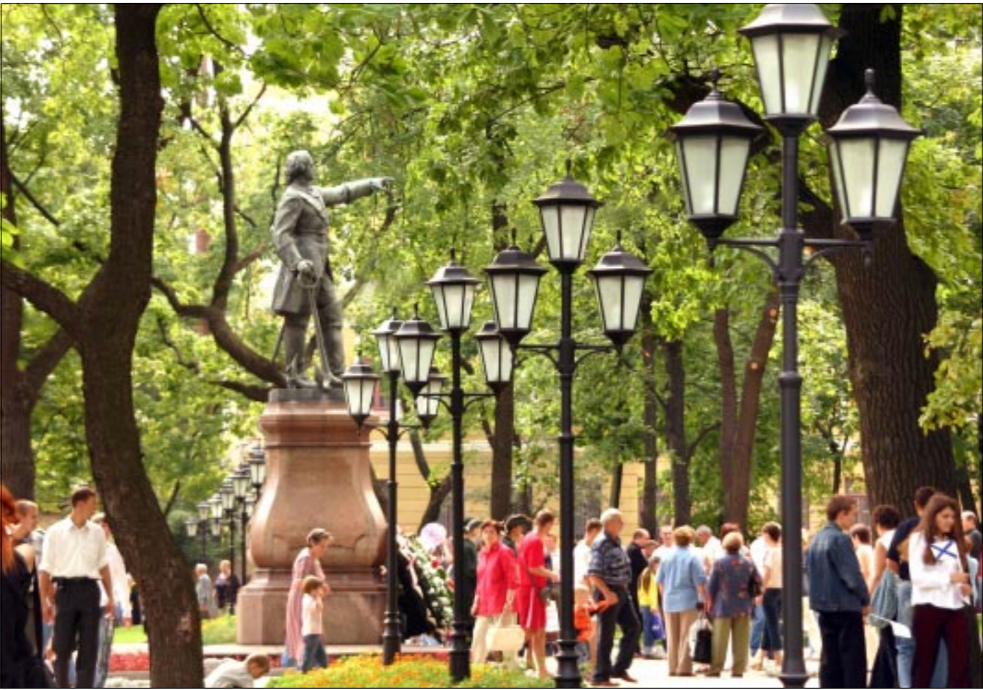
Обновленный, облагоустроенный Петровский сквер в Воронеже вновь был открыт для широкой публики в недавнее празднование Дня города.