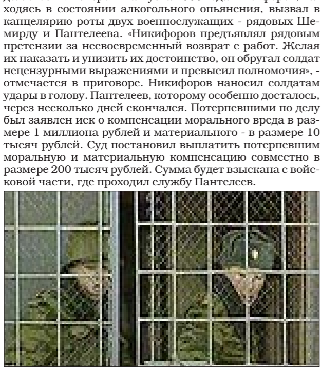
По материалам lenta.ru, rian.ru, vz.ru, news.ru.