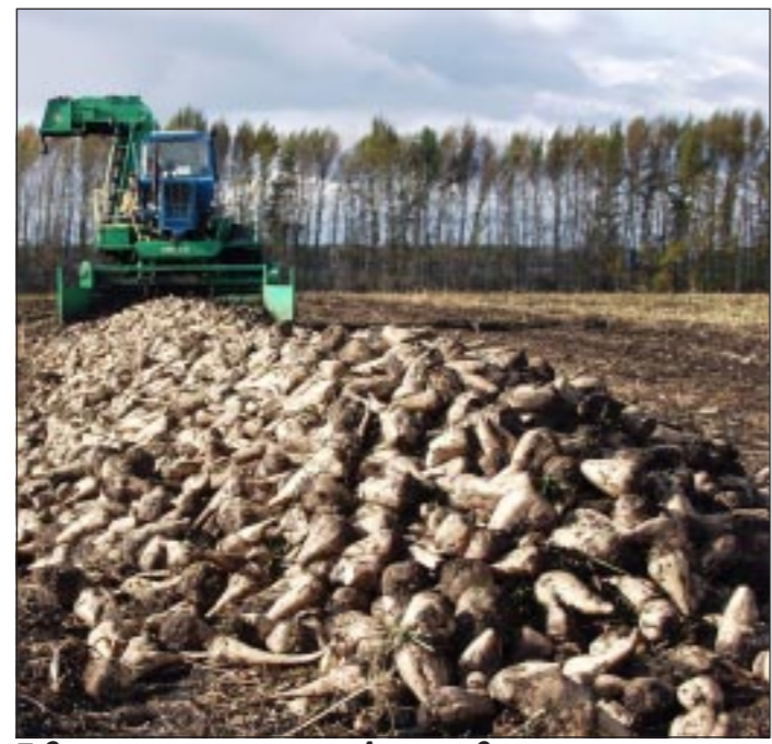
Свеклы накопили много. А дальше?

У воронежских свекловодов новая беда: выращенный урожай некуда девать