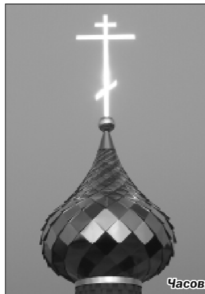
Часовня над истоком Волги с воронежской кровлей. Над ней установят этот купол.