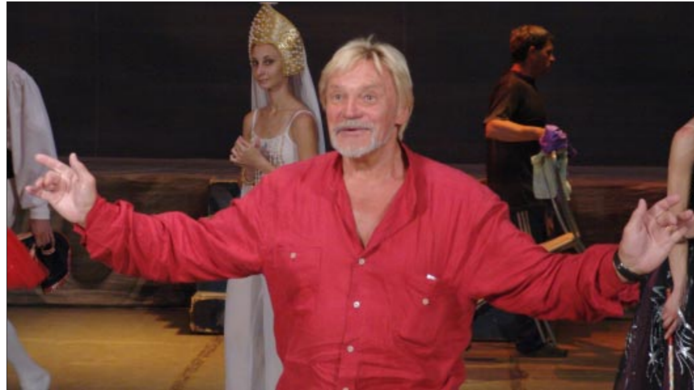
Народный артист СССР Владимир Васильев на репетиции балета «Золушка».

Не только премьера «Бориса Годунова» — многие планы корректируются в связи с реконст-