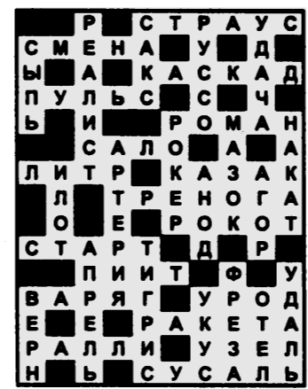
Ответы на сканворд от 14 октября