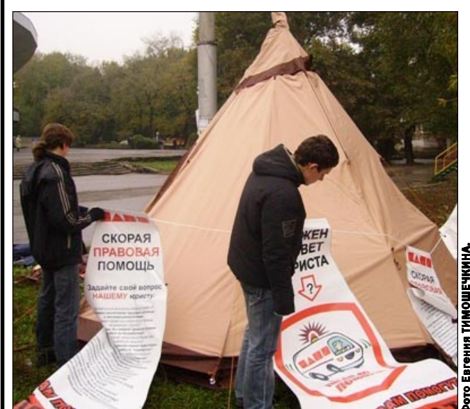
Молодежное движение «Наши» организовало в Воронеже передвижную «Скорую правую помощь».

Участниками проекта стали 20 школ, прошедших конкурсный отбор. Уже подготовлены 10 координаторов. Каждый из них работает с двумя школами своего района.