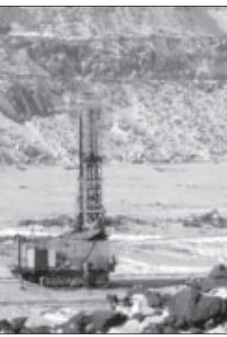
Самоходные буровые станки, выпускаемые воронежским ОАО «Рудгормаш», работают на рудниках более 20 стран мира.

Объем внешнеэкономического оборота области за прошлый год составил 994 миллиона долларов США. По итогам первого полугодия - уже 600 миллионов долларов. Отрадно, что объем экспорта впервые в начале реформ превысил (в 1,6 раза) объем ввозимых поставок. Наблюдается положительная динамика продвижения наших предприятий на мировой рынок. Лидеры экспортных поставок, продукция которых пользуется высоким спросом в странах ближнего и дальнего зарубежья - «Миндуборения», «ВАСО», «Воронежсинтезлауч», «Амтел-Черноземель», «Тяжмехпресс», «Воронежстальмост», «Рудгормаш», «Видеофон», «ВЗПП-Микрон». Причем, в последние годы товарная структура экспорта Воронежской области не ограничивается продукцией химического машиностроительного и радиоэлектронного комплексов. Из Воронежской области поставляются на экспорт зерно, лекарственные средства, мебель, различные кондитерские изделия, лигнероудочная продукция, шкуры крупного рогатого скота, керамические изделия, стекло, продукция предприятий легкой промышленности.