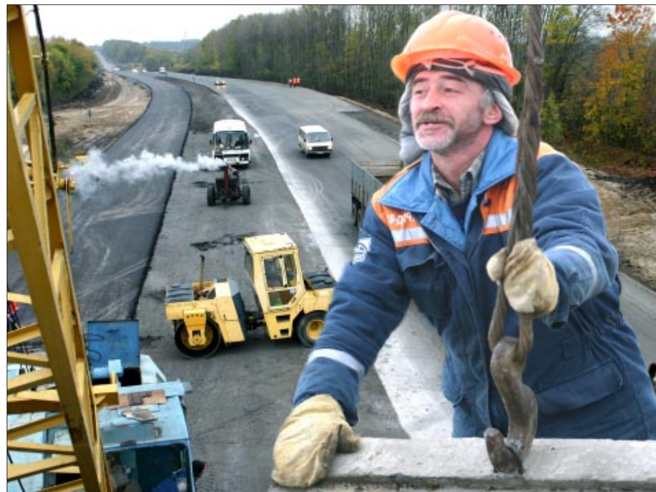
Строительство транспортной развязки, соединяющей Нововоронеж с Луганской трассой, вступило в завершающую стадию, поэтому строители ведут работы сразу с двух концов.