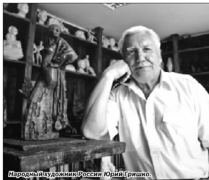
Народный художник России Юрий Гришко.

И, наконец, вынесенный в заголовок выставки, Виктор Сорокин. Мэтр живописи — мощный, яркий в своих пейзажах, в натюрмортах, яростный и буйный по своему живописному мазку молодой старец. В почти что девяносто лет — один из самых ярких представителей современного авангардного искусства не только в своей практике, но и в своих взглядах, в своей педагогике. Он еще несколько лет тому назад был жив,