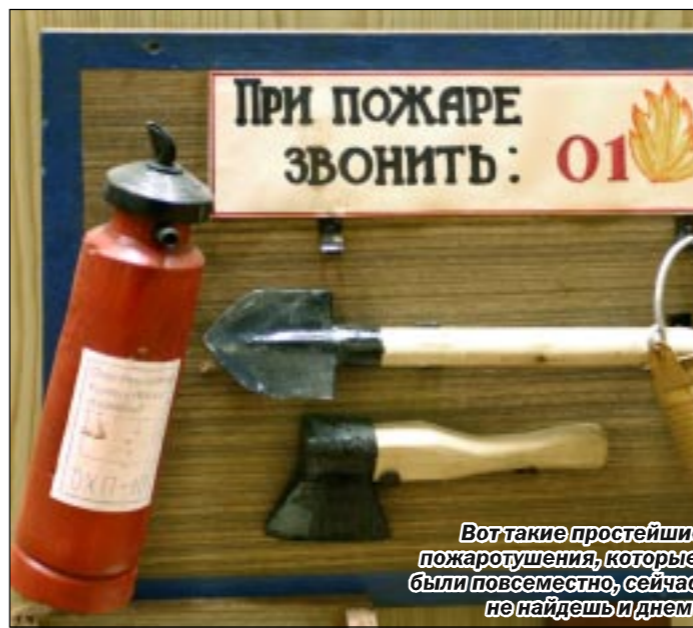
Вот такие простейшие орудия пожаротушения, которые раньше были повсеместно, сейчас на селе не найдешь и днем с огнем.