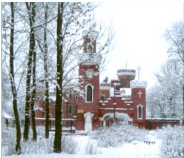
Фотоработы Владимира АСТАНИНА.