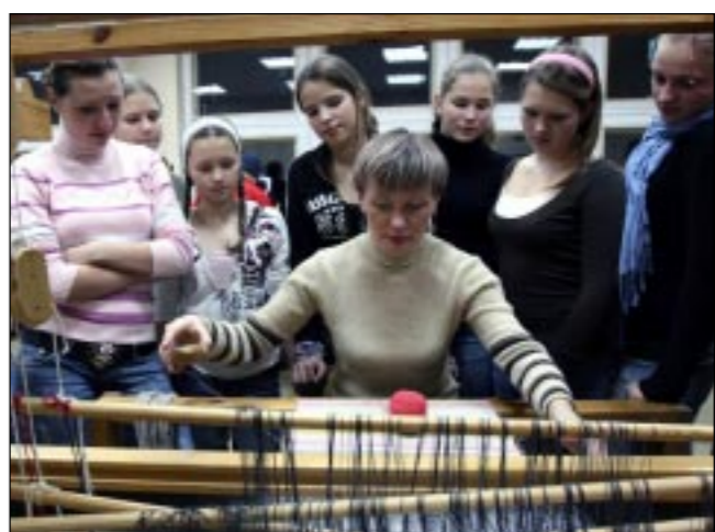
На снимке: члены делегации во время посещения отделения декоративно-прикладного искусства Витебского государственного технологического колледжа.