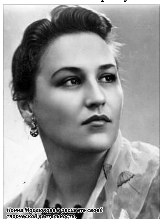
Nonna Мордюкова в расцвете своей творческой деятельности.

Знаменитая актриса Nonna Мордюкова попала в реанимацию Центральной клинической больницы с инсультом. Благодаря стараниям лучших специалистов «кремлевки» кризис миновал, и 81-летнюю народную любимицу перевели из отделения интенсивной терапии в обычную палату отделения неврологии. «Сейчас Nonne Викторовне гораздо лучше, - говорят врачи. - За последние несколько недель она впервые заговорила, начала есть, в состоянии наметилась положительная динамика». Тем не менее врачи по-прежнему делают все от них зависящее, чтобы поднять Мордюкову на ноги: они круглосуточно наблюдают за ее состоянием, несколько раз в день измеряют давление, следят за работой сердца, ставят капельницы и делают уколы. «Nonna Викторовна никогда не жалется, не сдастся, - восхищаются медики. - Мы уверены, что и это испытание она преодолеет». Ноябрьна Викторовна Мордюкова родилась 25 ноября 1925 года. Роль Ульяны Громовой в фильме «Молодая гвардия» (1948г.) принесла ей известность. Английская энциклопедия «Who's who» назвала Мордюкову в числе десяти самых выдающихся актрис XX века.