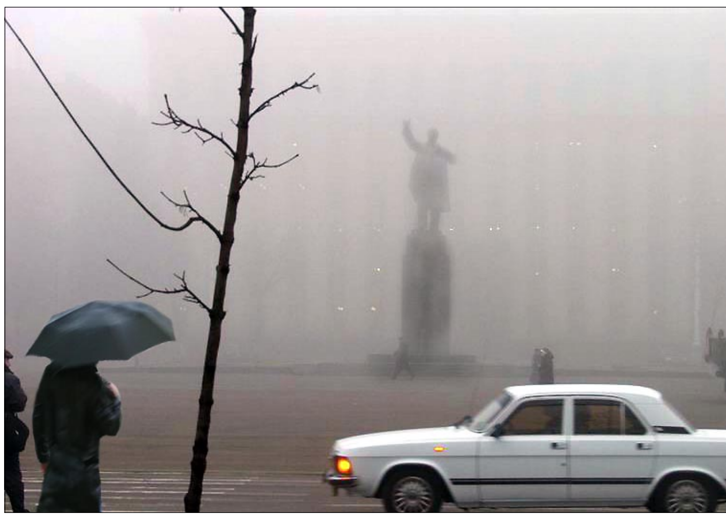
Воронеж. Первый день зимы.

Отдел распространения: тел. (4732) 39-00-87. Наборы открыток можно также купить в книжных магазинах г. Воронежа «Библиосфера», «Круг чтения», «Книжный мир семьи», «Светлана», книжках «Роспечати».