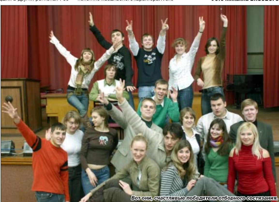
Вот они, счастливые победители отборного состязания.