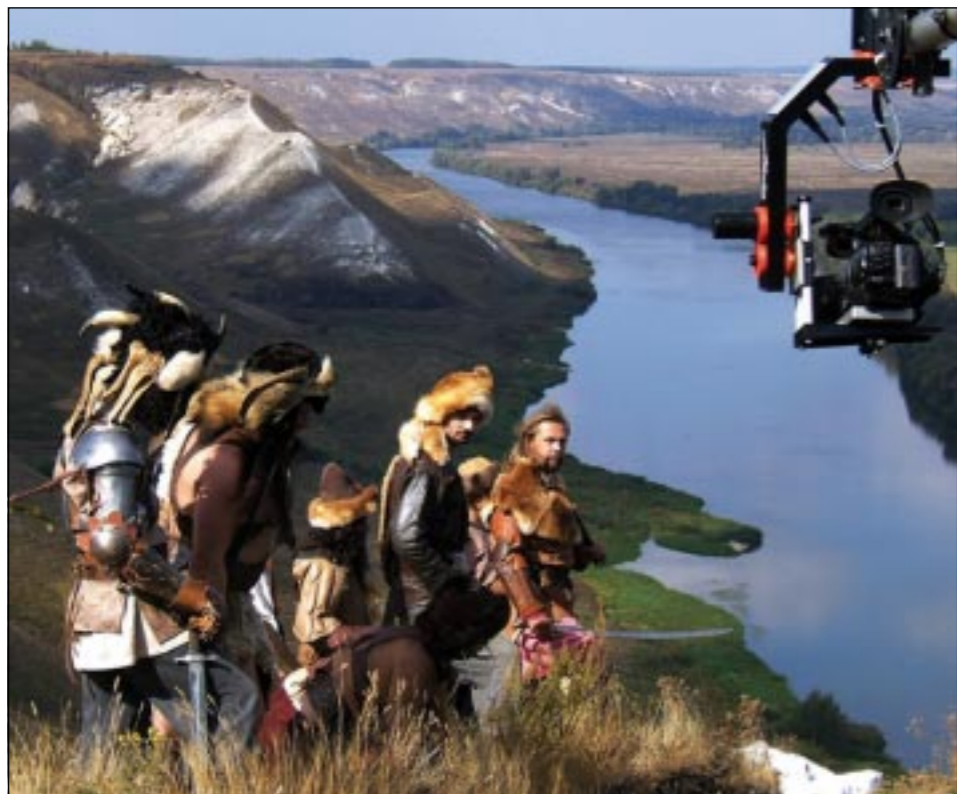
На съемках фильма «Легенда о Кудяре».