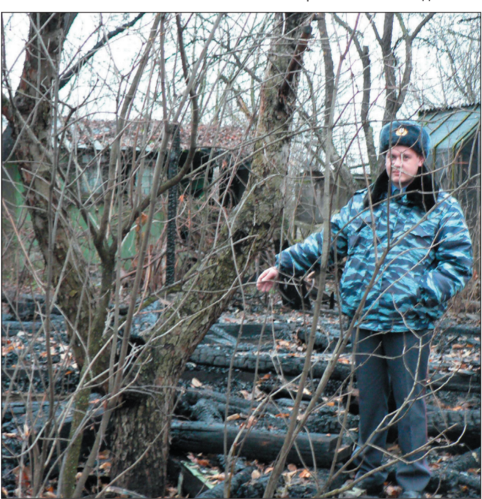
Все, что осталось от дачи в Ближних Садах после пожара.

Считают, что дачники - рабские сезонные и зимой их не выдать, но это утверждение верно лишь теоретически. На практике до 10 процентов от общего числа остаются зимовать. Девять из десяти таких жителей - беженцы из бывших советских республик. Как они живут, где работают - это уже отдельный разговор. Но то, что в случае поджога они не едут к себе домой по месту прописки - факт. Многие и живут потом с обгорелыми стенами. Специальных дачных поджогов, говорят милиционеры, практически не бывает, горят из-за неосторожного обращения с огнем. Как правило, бомж разводит посреди дача костер, чтобы погреться, или засыпает с сигаретой в кровати и просыпается на том свете. Кстати, в таких же обгорелых апартаментах жила и 49-летняя женщина, недавно ставшая жертвой пьяного убийцы. Ее обнаружили с рублеными ранами головы в дачном домике в Шилово. Такие преступления с сюжетом почти по Достоевскому и последующей кражей ничем не такую уж редкость. К владельцам шести соток приезжают желавшие пообщаться с дачной жизни с помощью бутылки. И если вначале хозяева радушно их встречают, а потом поднадошево гостю указывают на дверь, бывает, что «обидчики» убивают и прихватывают с собой его вещи. В данном случае убийца взял DVD-проигрыватель и телевизор. Поиманному дачному «Раскольникову» не избежать наказания. Возбуждено уголовное дело.