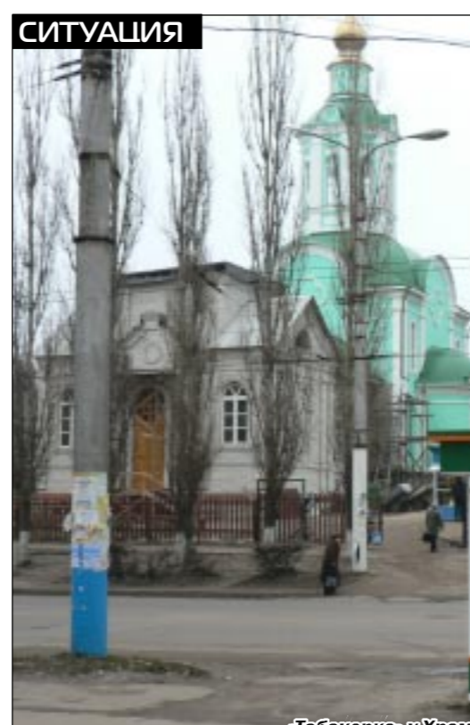
«Табакерка» у Храма, а слева возводится спорткомплекс.