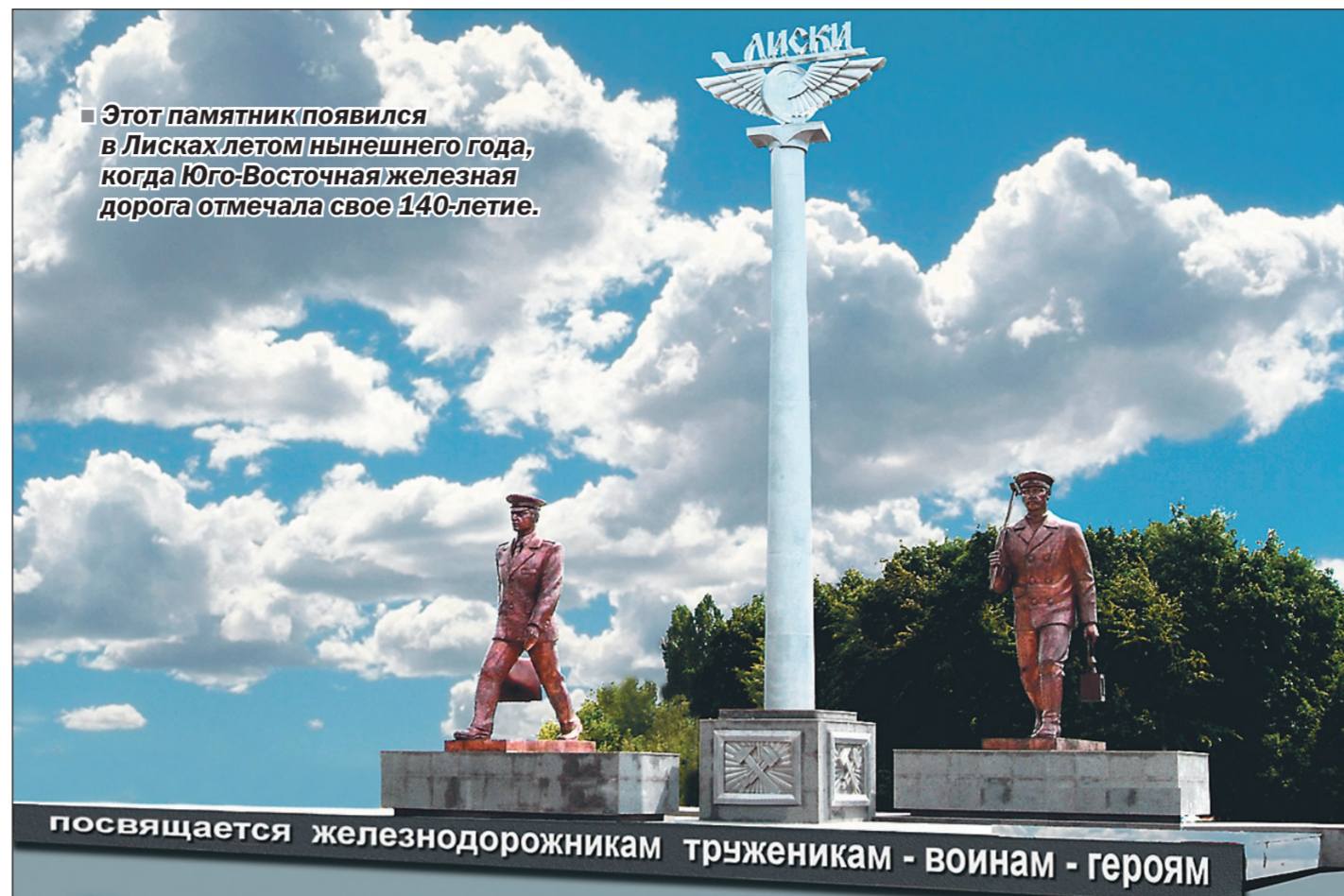
Этот памятник появился в Лисках летом нынешнего года, когда Юго-Восточная железная дорога отменяла свое 140-летие.

посвящается железнодорожникам труженикам - воинам - героям