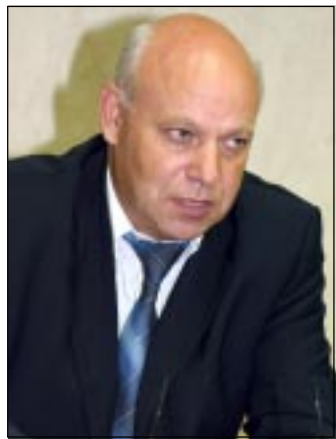
сколько раз превышают разумные реалии. В результате земля брошена.

Эти слова легко подтвердить материально: в районе произведено продукции и оказано услуг на 6 млрд. рублей (6 процентов прироста), говорится о вводе новых сельских и промышленных объектов, но опять-таки лично меня удивило другое: город пробирает идею – в 2008 году стать столицей Всероссийских сельских игр, а это – новые финансовые вливания, модернизация и строительство спортивных объектов... Думаю, что к подобной активности как раз и подталкивает закон о местном самоуправлении – администрация хочет зарабатывать и ищет такую возможность.