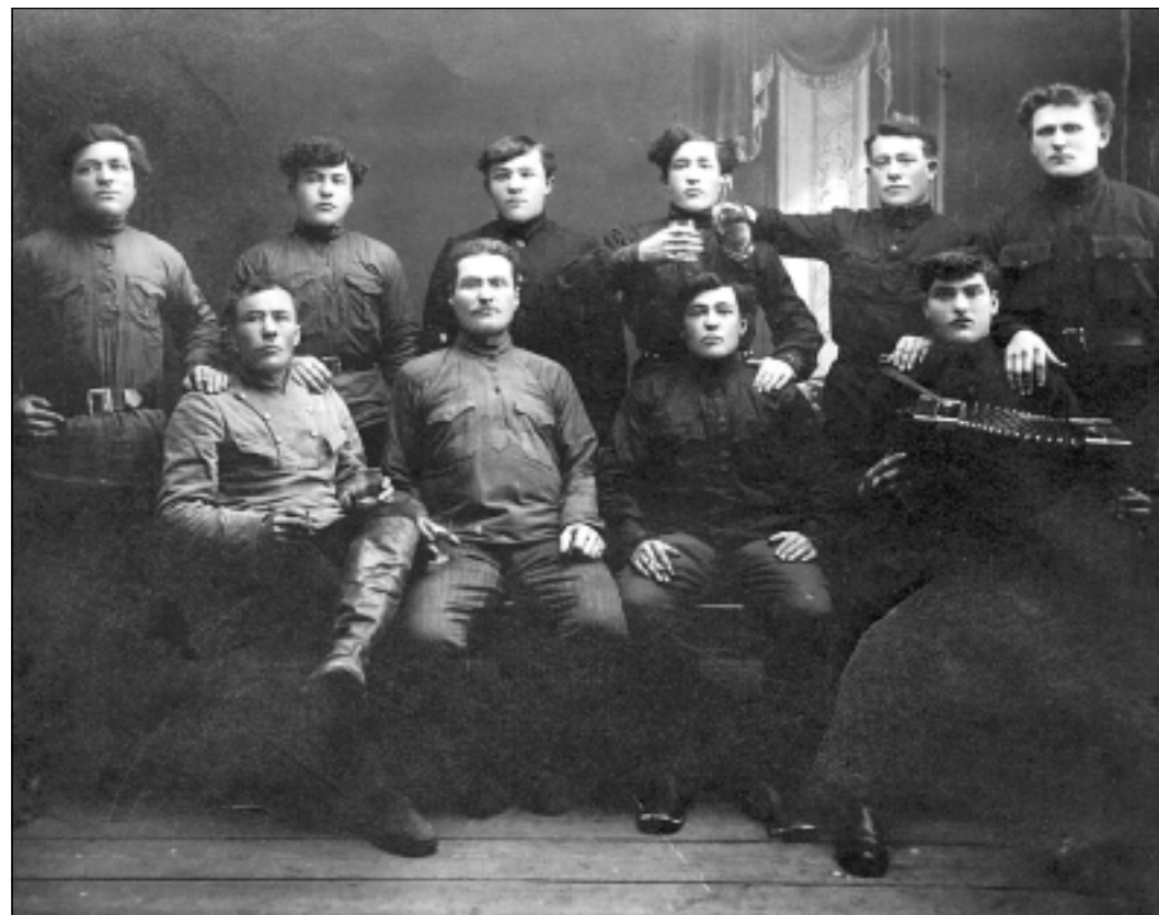
■ И на чужбине они берегли выправку и достоинство русской армии.