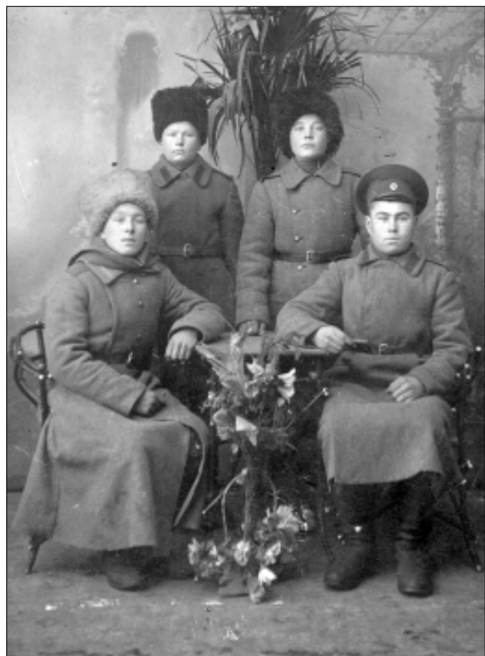
■ Они не верили, что эмиграция - это надолго, и мечтали вернуться в Россию.