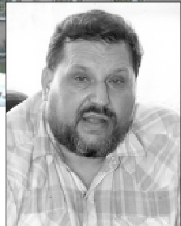
дневные стационары, но от меня отмахивались. С большим трудом удалось убедить начать такое строительство. Часть денег в него вложили сами строители, часть дали инвесторы, часть в виде отвода земли и затрат на инженерные коммуникации взяли на себя городские власти. Предполагается, что первый и второй этажи займет спортивно-оздоровительный комплекс, а верхние шесть этажей – палаты дневного стационара.