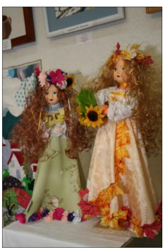
Наш ответ Барби.