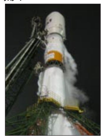
«Союз-2-16» на старте.

Для нашего коллектива 2006 год стал насыщенным и плодотворным. В течение года совместно с коллегами из Научно-исследовательского института космического машиностроения мы провели два успешных комплекса наземных испытания ракетного двигателя РД-0124 в составе ступени ракеты «Союз-2-16». Они позволили убедиться в работоспособности двигателя в составе ракеты и перейти к этапу летных испытаний. Главное заключается в том, что мы на деле подтвердили: научно-технический, производственный потенциал КБХА позволяет сегодня решать самые сложные задачи.