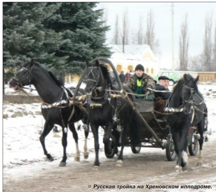
Русская тройка на Хреновском ипподроме.