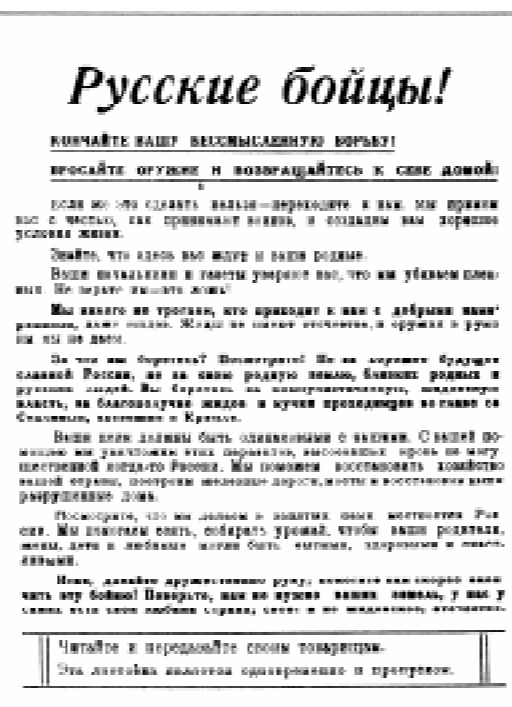
Листовки, которые использовала фашистская пропаганда на территории Советского Союза.

Агитация на оккупированной территории основывалась на большой лжи. Пропагандисты внушали населению, дабы поражения фашистов на фронтах воспринимались как победы, порабощение народов как освобождение, террор как обеспе-