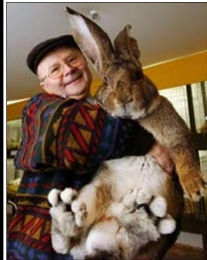
По материалам annews.ru, dni.ru, newsru.com, lenta.ru.