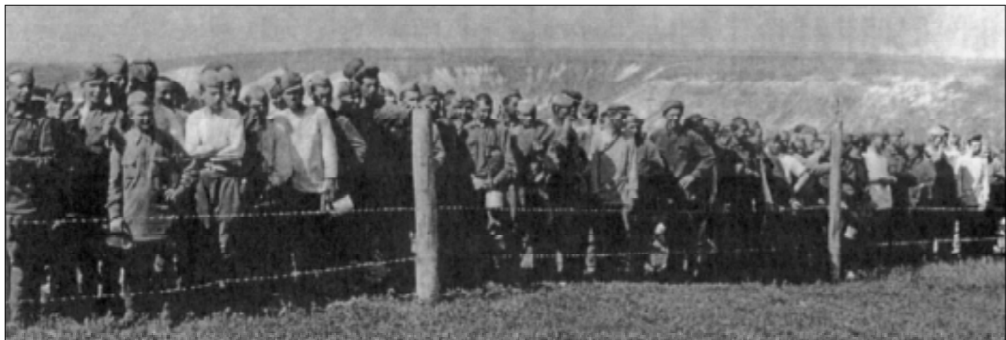
Копицагерь советских военнопленных в степях Придонья. Лето 1942 года.