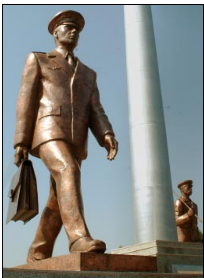
Это фрагмент памятника железнодорожникам в Лисках. Как уже писала «Коммуна», местные островослы окрестили монумент «Бегущие из города». И основания для такого горького юмора самые серьезные.